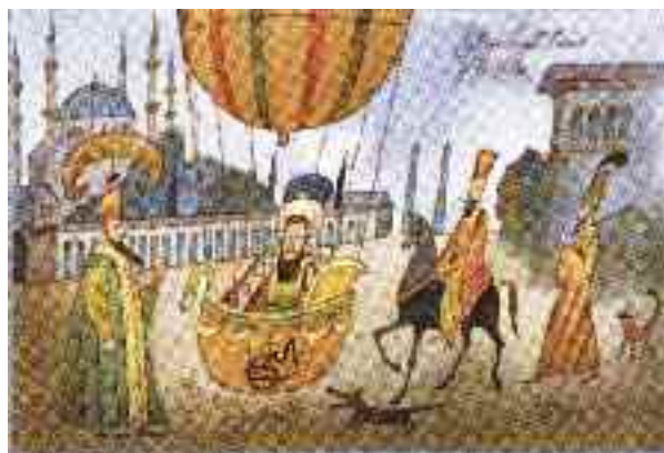
Adolf Born: III. Szelim szultán repülése , akvarell, 2007