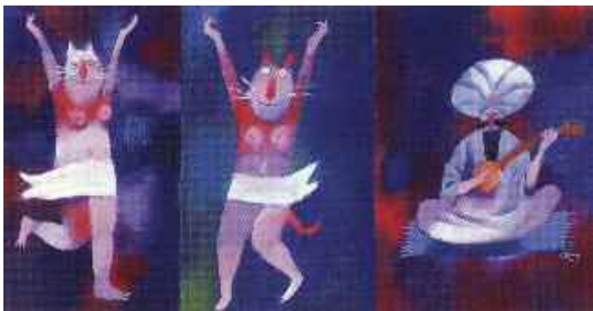
Adolf Born: A hárem táncosai , pasztell, 2010