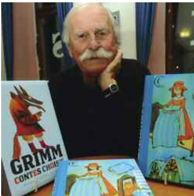
Az általa illusztrált Grimm-könyvvel