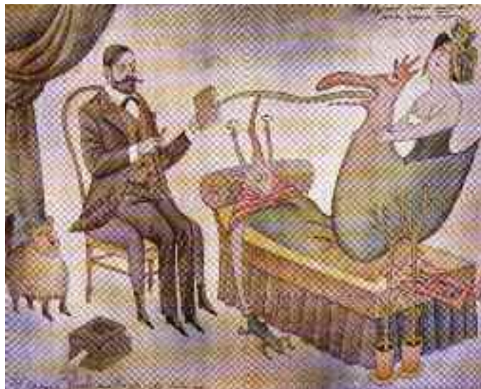
Adolf Born: Sigmund Freud saját álmát elemzi; litográfia, 2000