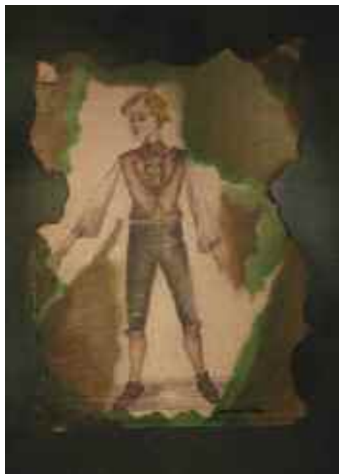
Lukácsy Ildikó tervei A vitéz szabócska című előadáshoz, 2008