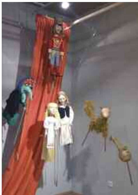
Bábfigurák az Ariel előadásából