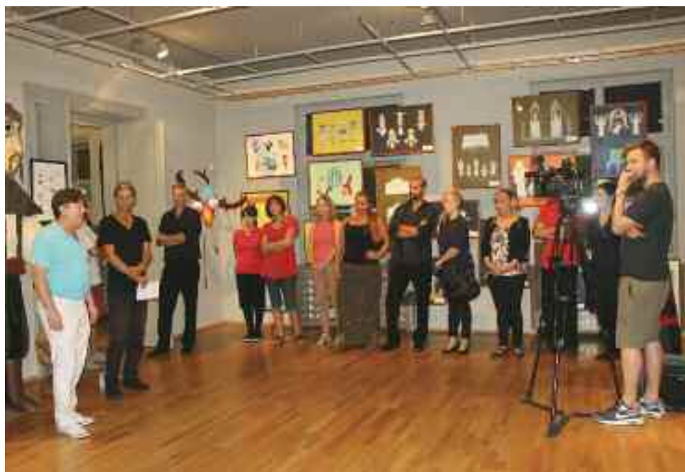
Az Ariel kiállítás résztvevői