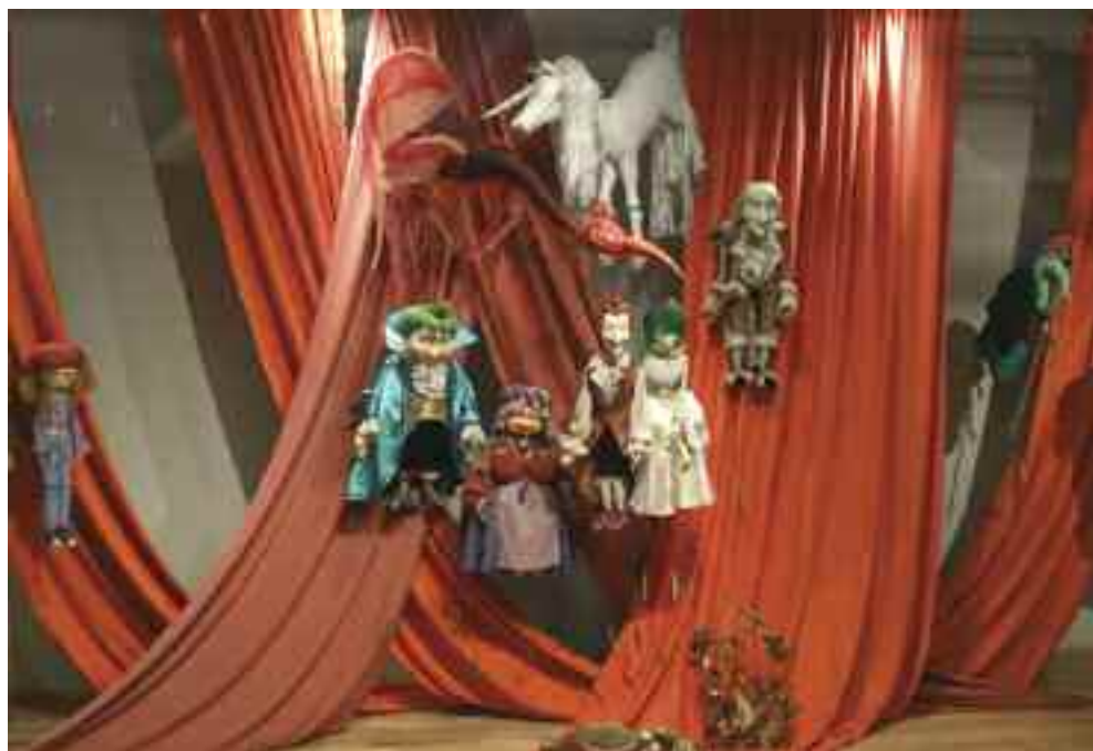
Bábfigurák az Ariel-kiállításon