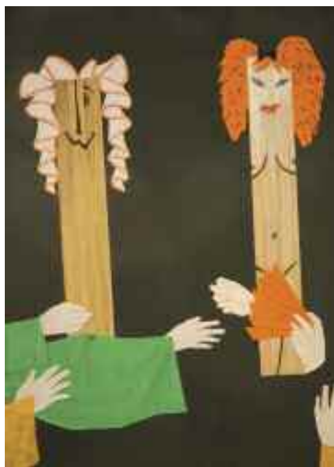
Négy fejezet a nevetés történetéből, 1967