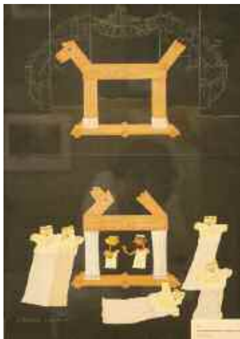
Óh, Rómeó... Óh, Júlia, 1995