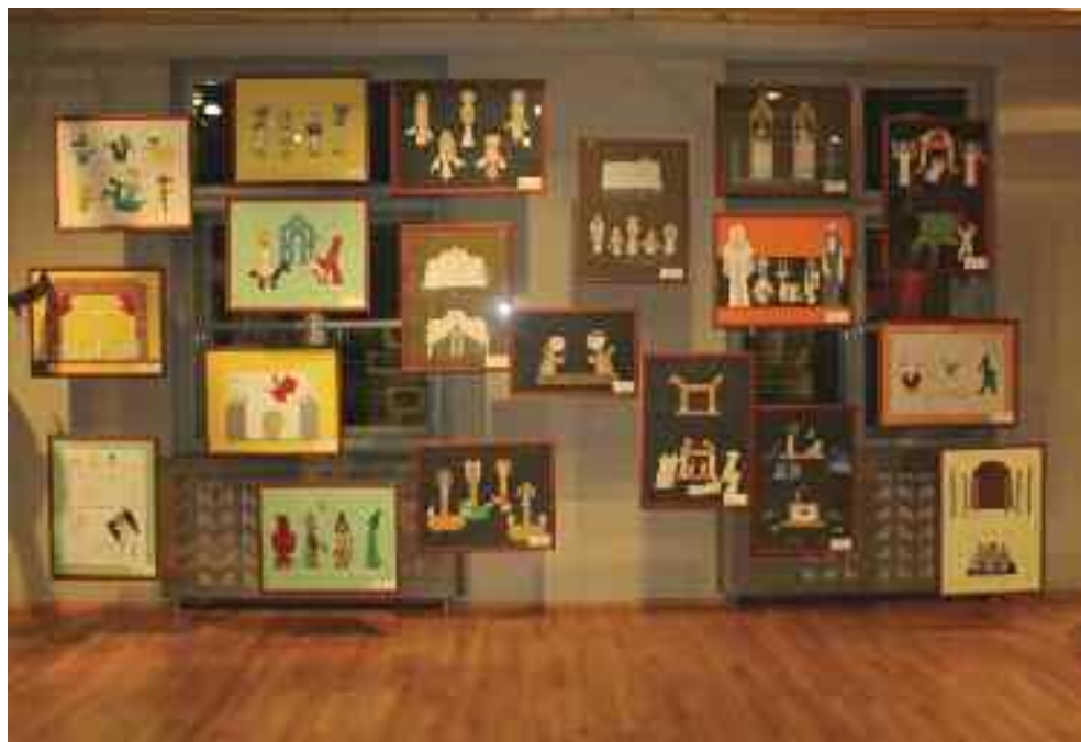
Haller József báb- és díszlettervei