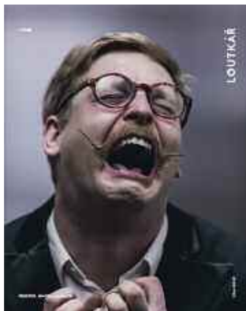
A 2016-os Loutkár-számok címlapjai