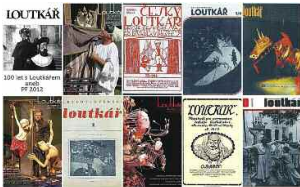
A régi Loutkár-számok címlapjai