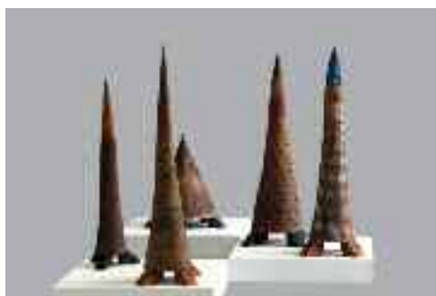
Királyi család, 2015