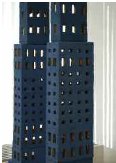
Felhőkapu (részlet), 2013