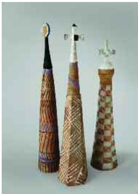
Világvallások I-IV, 2006