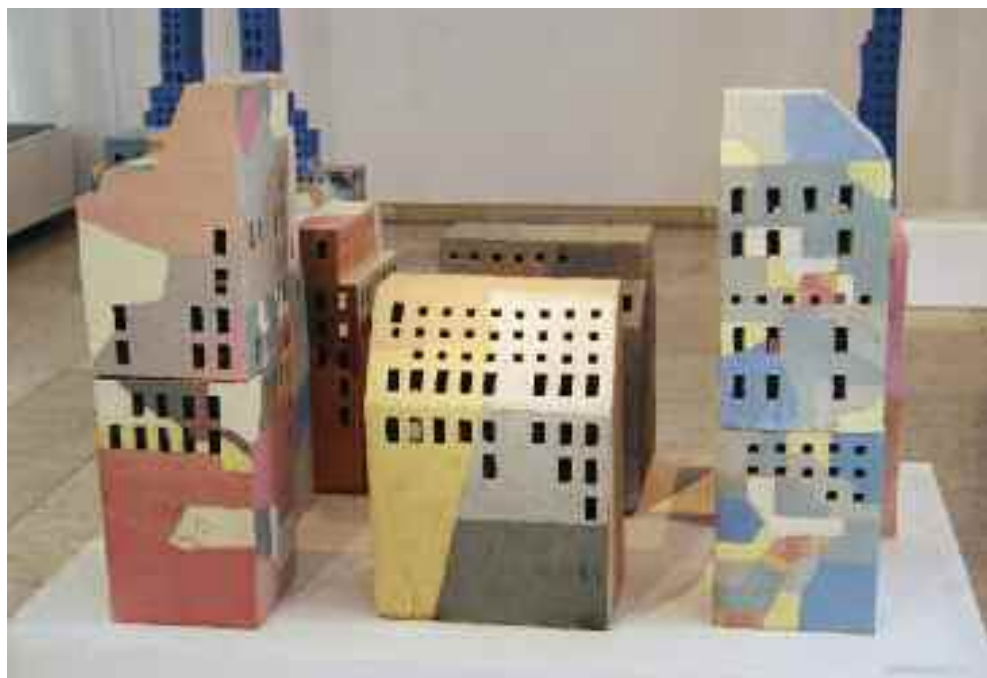
Az én városom - 2012-2013