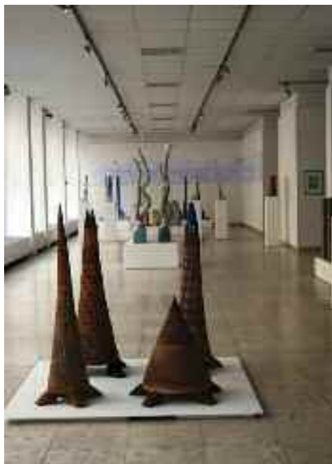
Kapuk, házak, emberek, 2012. Budapest Galéria