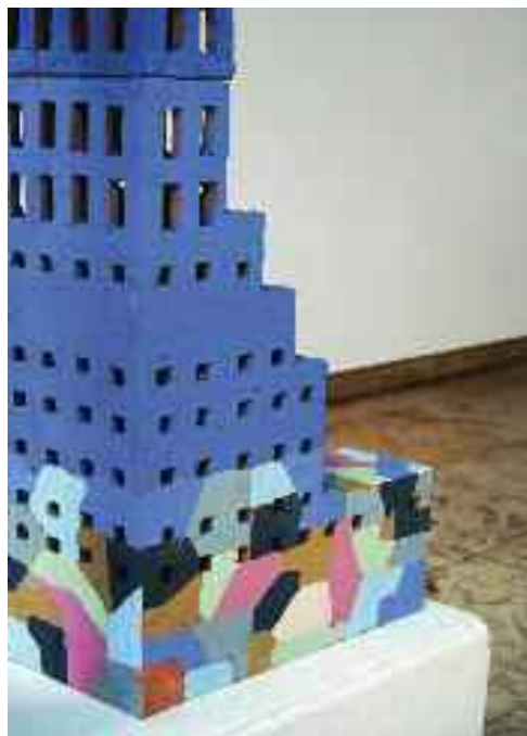
Felhőkapu (részlet), 2013