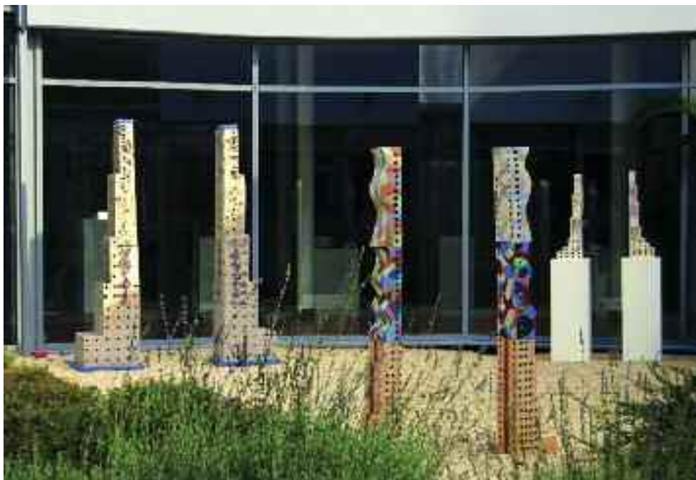
Kapuk – szabadtéri kiállítás, 2012

a méret, illetve a lépték. Ez egy, a befogadót finoman a rálátás pozíciójába helyező, de a mű tartalmi és szimbólum-világa által egzsersmind mű-szereplővé is avató kerámiaegyüttes, amely valóságos élményeket és emlékeket idéz – hivatkozhatunk akár a lakótelepeket átlengő panel-létre, az utazásaink közben, vagy fotó- és filmélményeink során rögződött amerikai felhőkarcoló- és nagyváros-képekre, vagy a dél-amerikai maja kultúra misztikus építményeire –, amelyek révén otthonosság és idegenség-érzetek, vonzódások és taszítások élesztődnek, kavarnak a befogadóban. Embernek és épített produktumainak, tereinek, befogadó otthonainak és riasztó közegeinek hol azonosulásra, hol elutasításra készítő tárgyiasult, átszellemített kerámia valóságmodelljei állnak előttünk. Visszatulva az ezredforduló előtti alkotóperiódusok álomittas, szenvedélyes nőalakjaira és mitológiai lényekre, mint központi jelentőségű médiumokra, fontos jellemző, hogy e sorozatokká rendeződő, egységes műcsoportokba szerveződő munkák körében sohasem jelenik meg az ember, vagy valamiféle élő, organikus