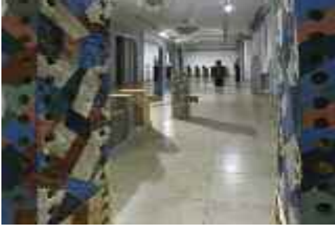
Az én városom-kiállítás részlete, 2016. Gaál Imre Galéria