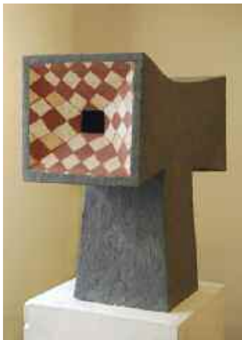
Keresztúton III, 2007