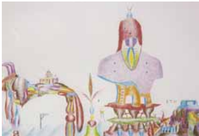
Barcsai Tibor: Esztergomi kiválóság mellszobra, 1988