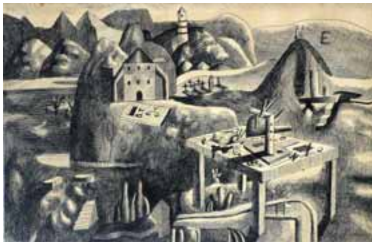
Barcsai Tibor: Selmecbánya