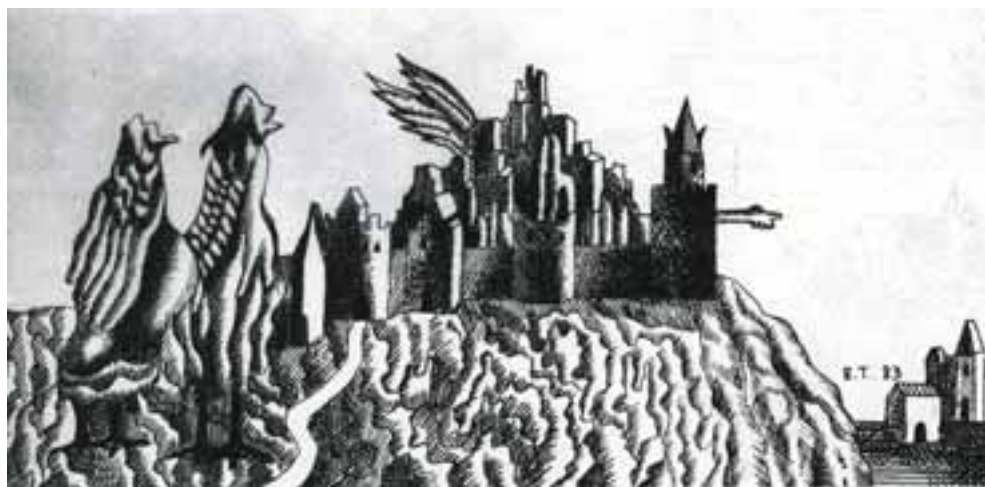
Barcsai Tibor: Két angyal válaszáton, 1983