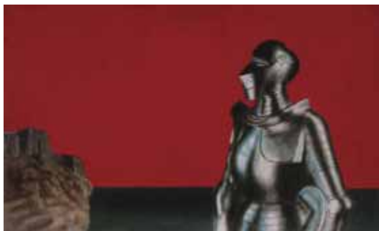
Barcsai Tibor: Esztergomi lovag