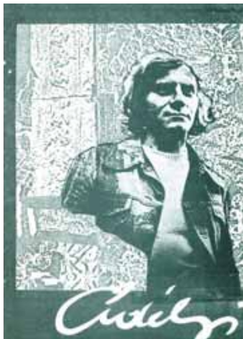
Kiállítási meghívó, 1980