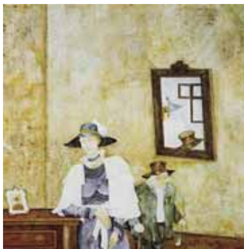
Erdélyi János György: Az ünneparcú. Hommage à József Attila , 1989