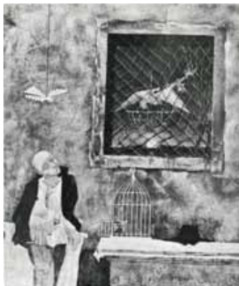
Erdélyi János György: A madárfogó álma , 1985