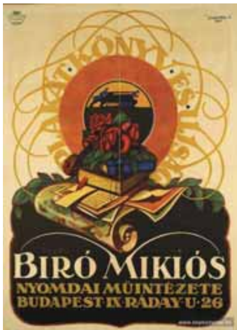
Jaschik Álmos plakátja, 1917