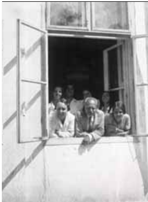
Esztergomi „repülés”, 1932. július