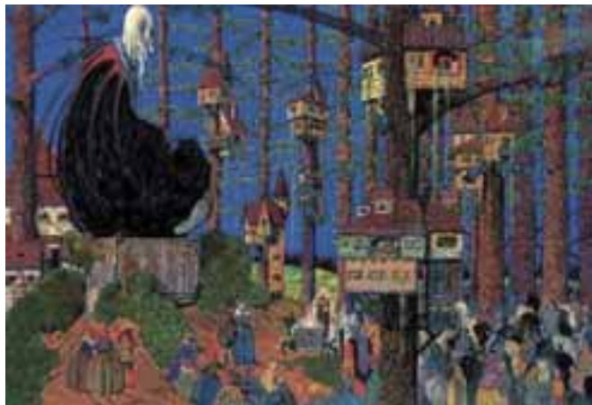
Jaschik Álmos: Ahol a mesék születnek