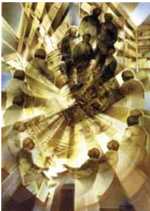
Jaskich Álmós: Őnarcképmontázs