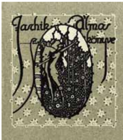
Jaschik Álmos könyve