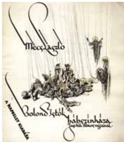
Jaschik Álmos: Mécs László: Bolond Istók bábszínháza , címlap, 1932