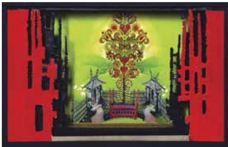
Jaschik Álmos: Csongor és Tünde, díszteterv, 1937