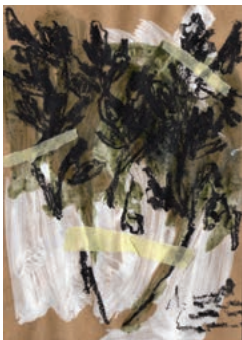
Herbárium 3, 2018