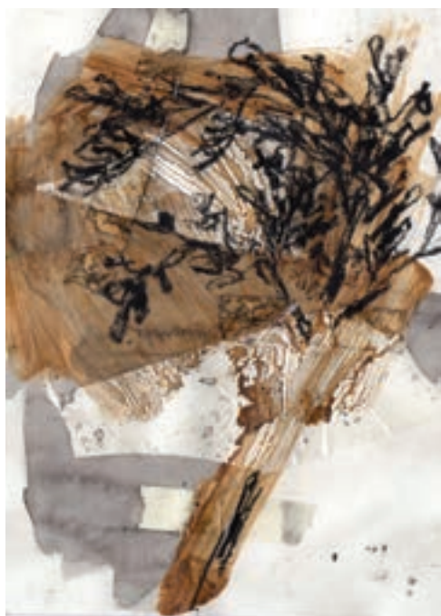
Herbárium 2, 2018