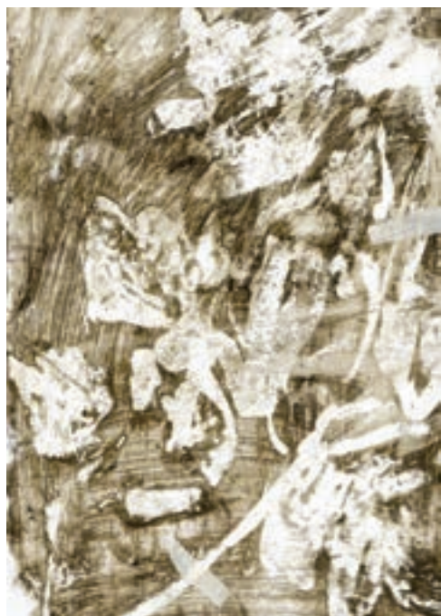
Herbárium 7, 2018

Legalább ilyen érdekes felismerés az is, amikor a grafikai prés alatt nyomtatott herbáriumot figyelve végül hasonló tapasztalathoz jutunk.