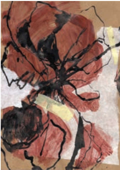
Herbárium 1, 2018