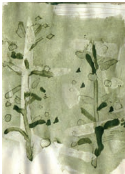
Herbárium 6., 2018

Argyelán Zita is egy évvel ezelőtt elcsomagolt, és egy lakásfelújítás alkalmával előkerült herbáriumból merít, amikor ezt a sorozatot készíti. A keze ügyébe akadt iskolai növény-gyűjtemény az átlapozását követően ismét elkallódott, hogy még néhány év elteltével újabb csendes órára szippantsa magába azt, aki majd rátalál. Addig pedig marad a tanulmányozással eltöltött