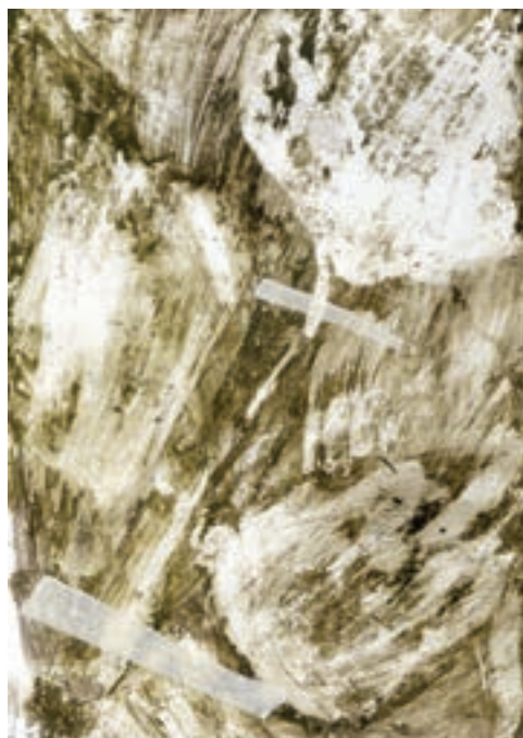
Herbárium 8, 2018