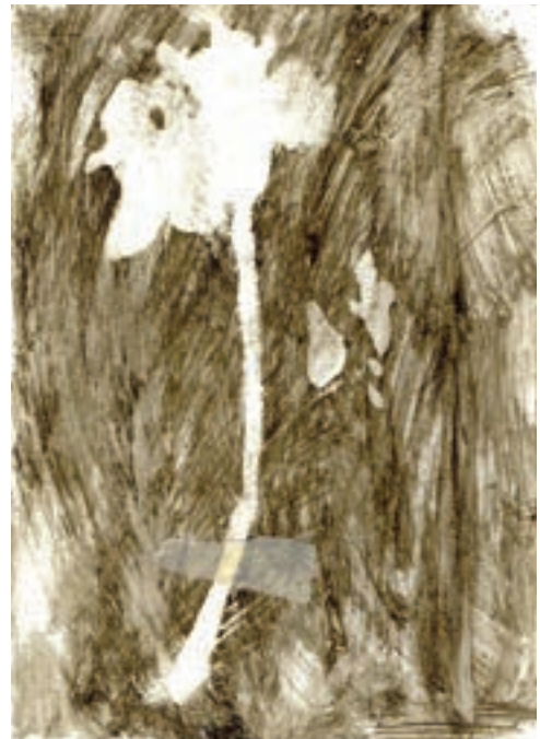
Herbárium 10, 2018