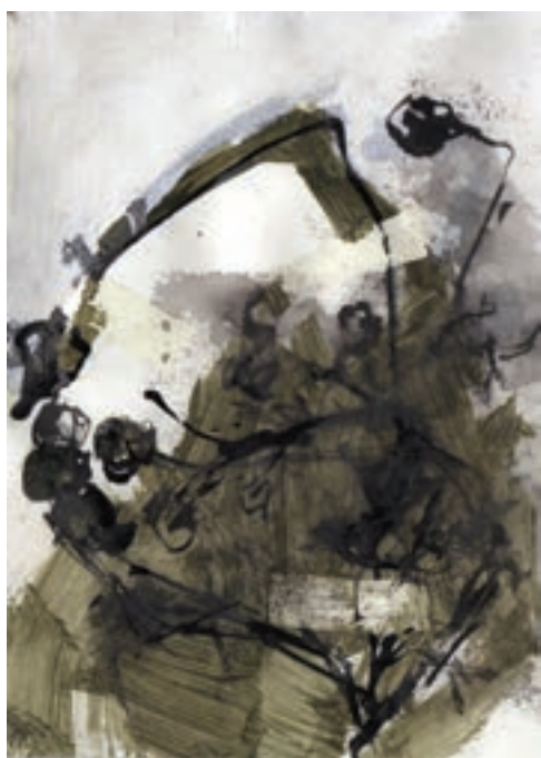
Herbárium 4, 2018