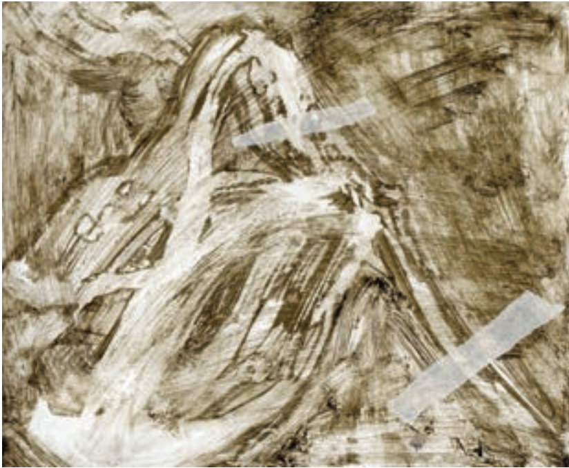
Herbárium 9, 2018