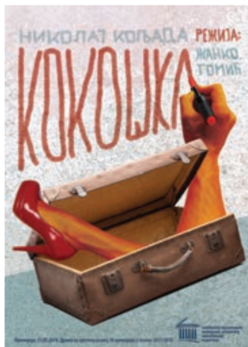
Кокoшка (Kokoška), 2018