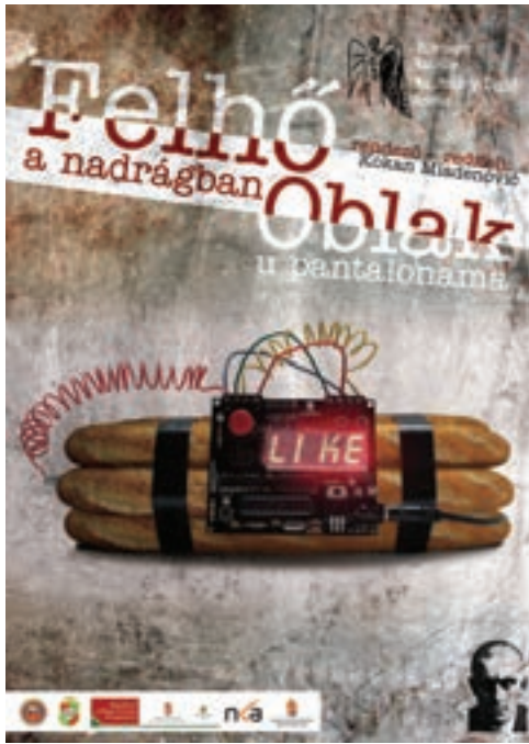
Felhő a nadrágban, 2017