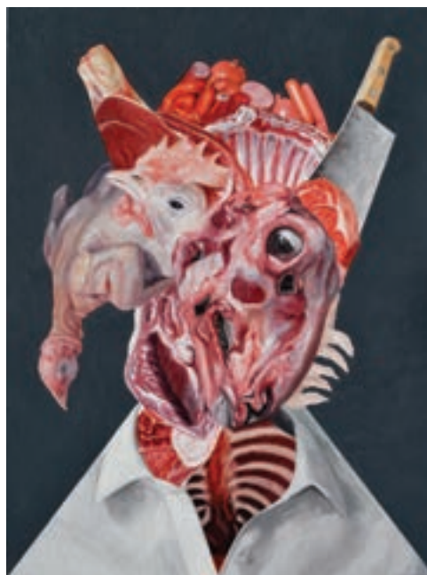
A hentes, 2016