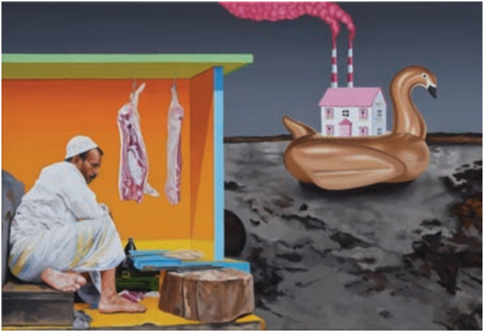
A bárka, 2017