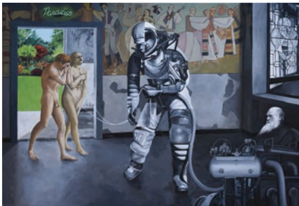
Küszetés a Paradicsomból, 2017