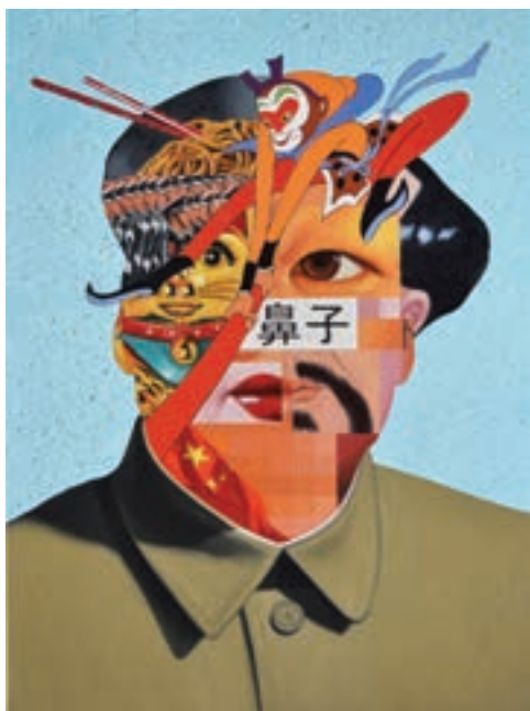
A kínai, 2016