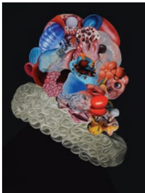
A kalmár, 2016

Meglepettségünket fokozza még, hogy az élő és a holt, a gyönyörű és a ledér, az életszerű és a művi a higgadt, kimunkált hideg esztétikában egészen jól megférnek egymás mellett. Pazarló lelkesültségünkre a kiábrándító valóság leleplezése: gyógyír. A kettősségek megválaszolásával az emberi gondolatvilág eltérő mércéit támasztjuk alá. Megdöbbenünk abbéli felfedezésünkön, hogy Kis Endre képeinek megfogalmazásait, hangulatvilágát szabadon, néha teljesen eltérően értelmezhetjük. Egyetlen témát, egyetlen élet(tan)i mozzanatot is hol tárgyilagossá, hol szubjektívvá, hol szenvedélyesnek, hol szenvtelennek tudunk megítélni. Valóban szenvedélyes ítések tudunk lenni, de a hangulatainktól függően ítéljük meg a virtuális térben történeteket, dolgokat és állapotokat. Pusztán ráérzünk, vagy ráközelítve meg is tudjuk érteni Kis