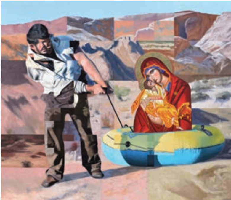
Menekülés Egyiptomba, 2017