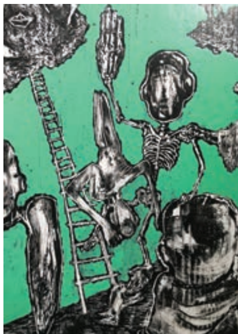
Métely (részlet), 2018

kiürített ablaktalan szobában várjuk a végérvényes, elkerülhetetlen és visszafordíthatatlan véget, ami úgy tűnik nem következik be, ahol a vég egy mindig azonos játék örök ismétlődése. Lak figurái ebben az örökös ismétlődésben talán az utolsó emberi lények, akik torzójukban idézik az individualitás évszázados hagyományait, míg identitásukat pusztán csonkolt és megállíthatatlanul pusztuló-foszló testek jelölik. Bresson (és néha Fassbinder) tereiben tudnak így szenvedni az emberek. Lak kifordítja a konstruktivista El Liszickij megfogalmazását: „A teret mint eleven testünk festett koporsóját elutasítjuk magunktól”. Lak számára még a táj, a rét zöldje is a perspektíva koordinátái közé szorított szárnalmas szabadság-illúzió csupán.