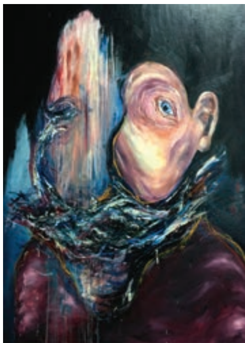
Elnémított Vénusz, 2016–2017