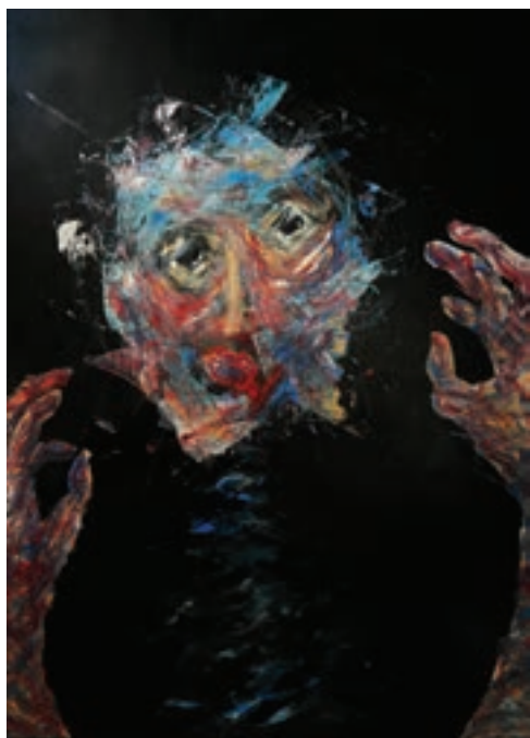
Küzdelem a démonaimmal, 2015