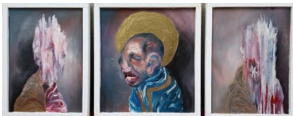
Crome gold triptyhon, 2017