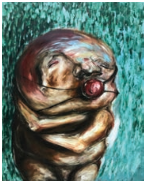
Apollion (maszkot visel), 2017