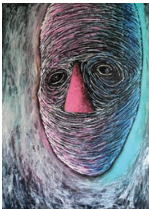
Új apostol III., 2016