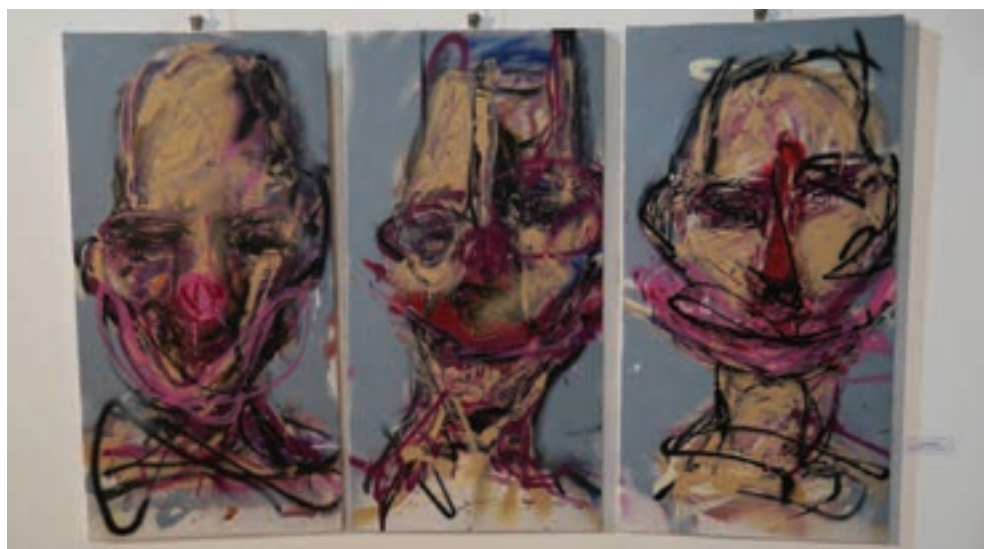
Szent bohócok, 2016