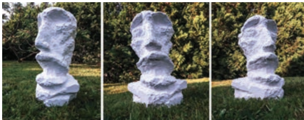
Fehér fej, 2017