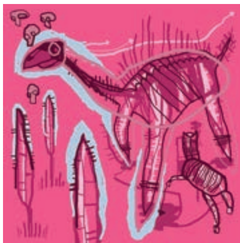
Baba dino, 2017