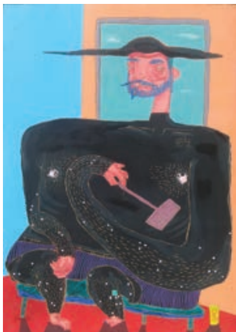
Richike ülve, 2016