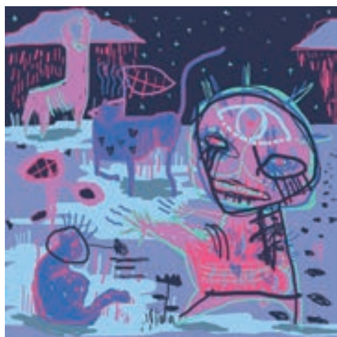
Geopárd gepárd az út szélén, 2017