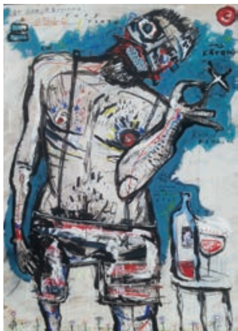
Richike állva, 2016