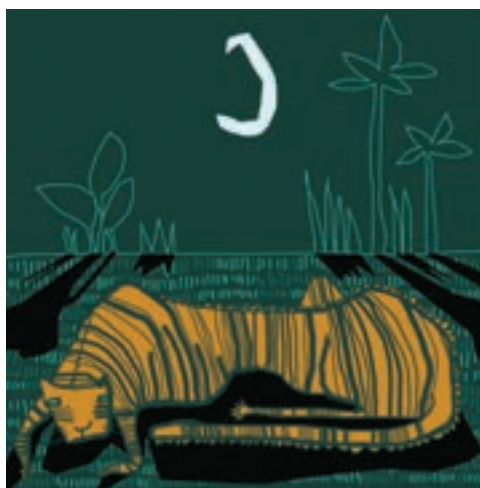
Kis tita, 2017