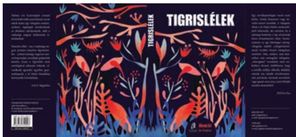
Tigrislélek * Válogatás a vajdasági magyar prózairodalomból. Újvidék, 2017. Forum, Jó Pajtás, Magyar Szó