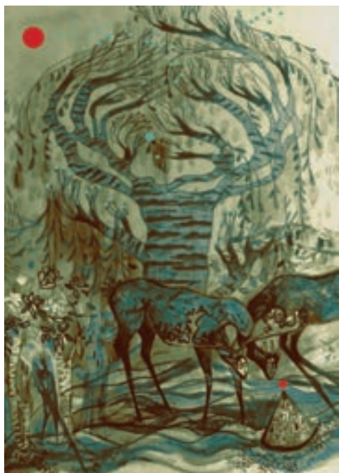
Cím nélkül, 2018