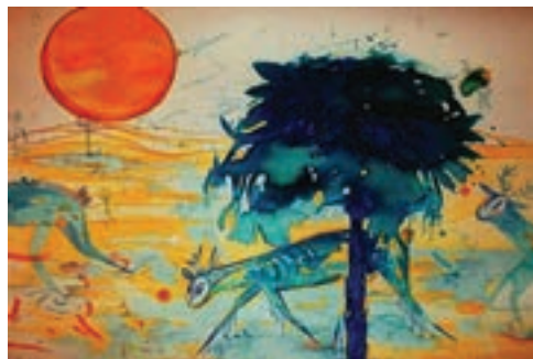
Cím nélkül, 2018

Magánmitológiájának különös színtereit szarvasok járnak be. Spórák, gömb alakú energianyalábok, indák között bóklásznak. Rítusokat végeznek az illanékony, akvarellés tájakon. Keresik, kergetik és csalogatják egymást. A születés utáni megismerés és