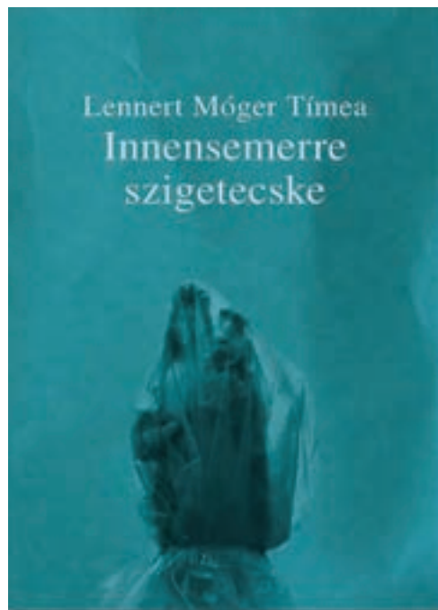
Lennert Móger Tímea kötete Stock János fotóival