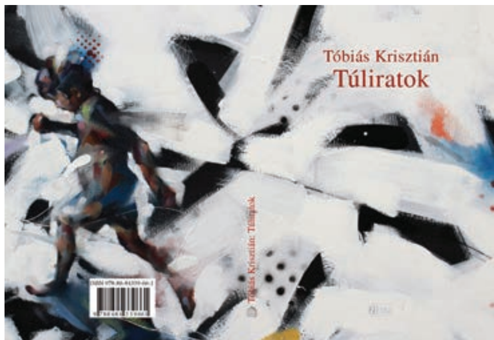
Tóbiás Krisztián verseskötete Lázár Tibor illusztrációival