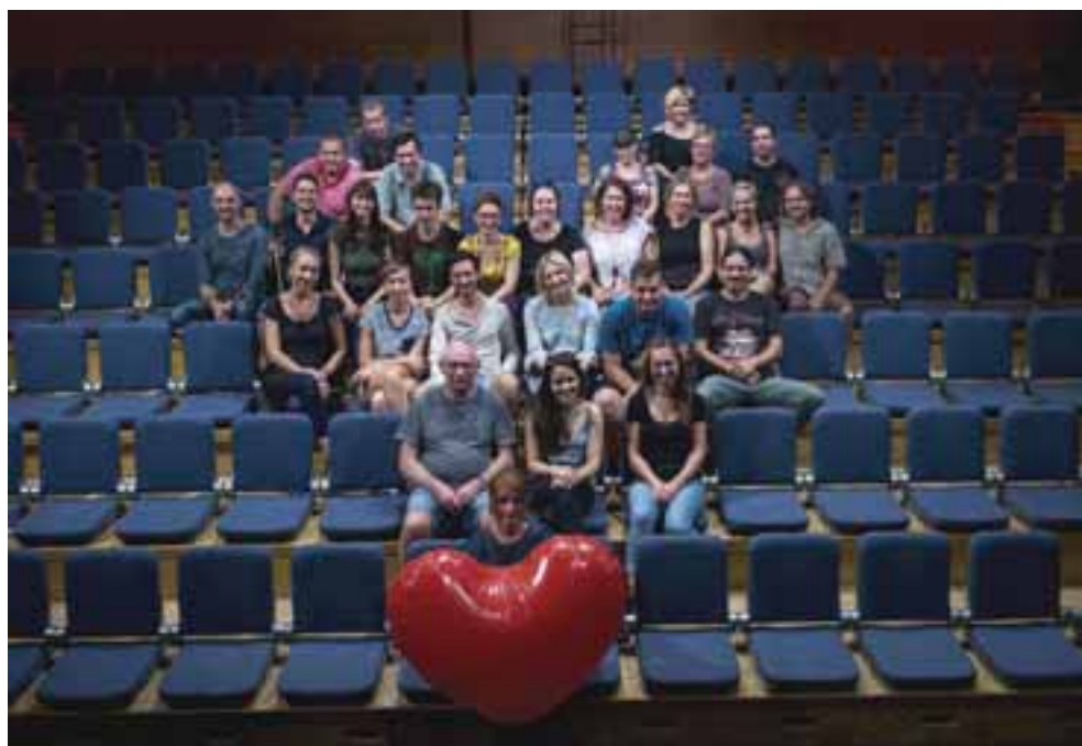
A bábszínház társulata, 2018