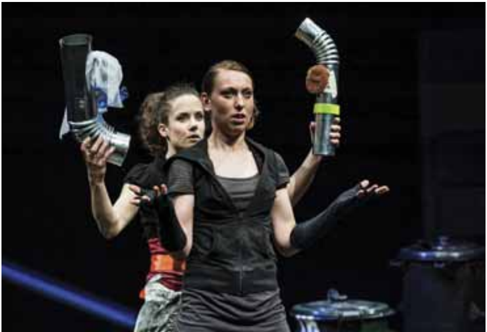
Hamupipőke , 2014. R: Vidovszky György.