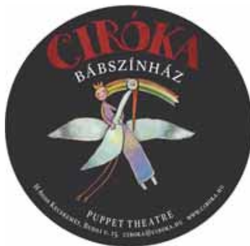
A Ciróka Bábszínház logója