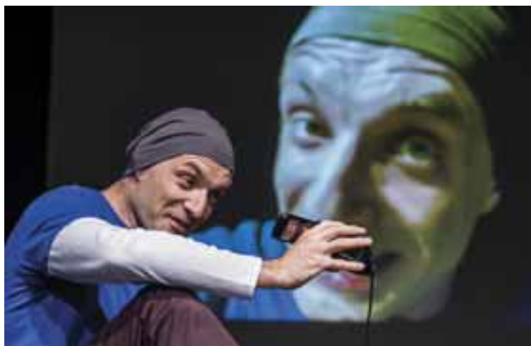
EgyMás, 2015. Rendező: Ivanics Tamás