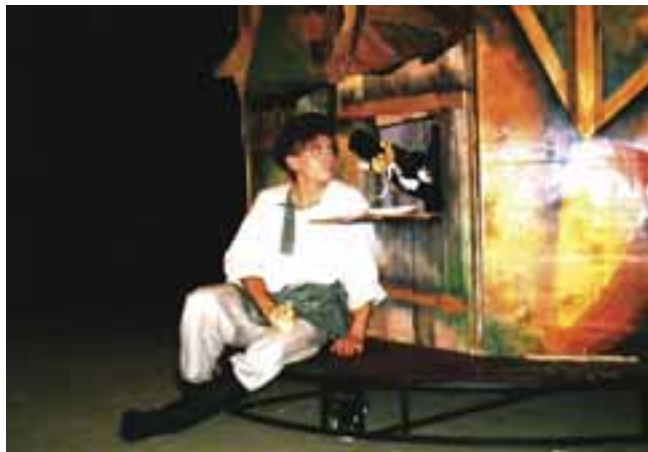
Mese a halászról meg a kis halról, 1993. R. Kiszely Ágnes