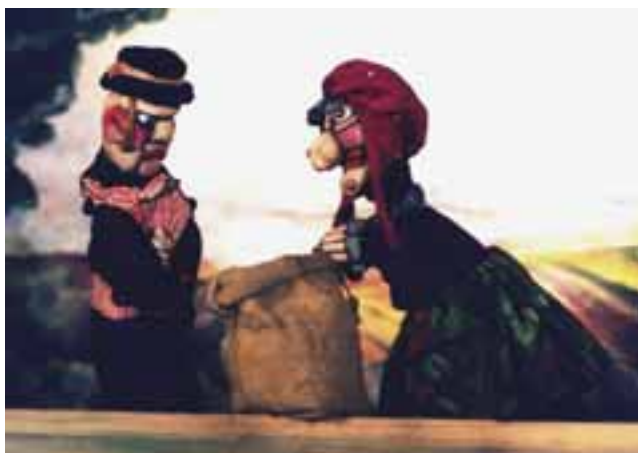
Ördögös mese, 1996. R. Kiszely Ágnes