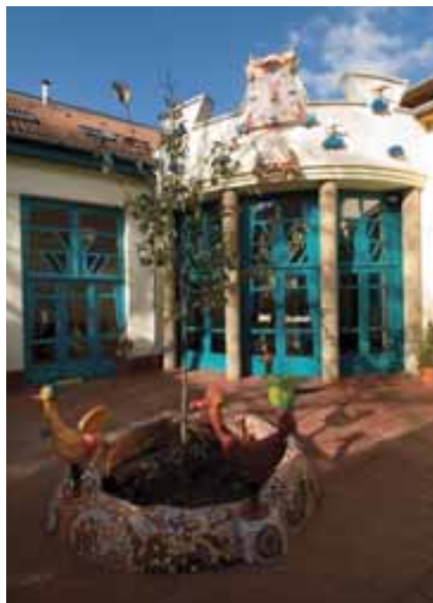
A Ciróka Bábszínház épülete az udvar felől