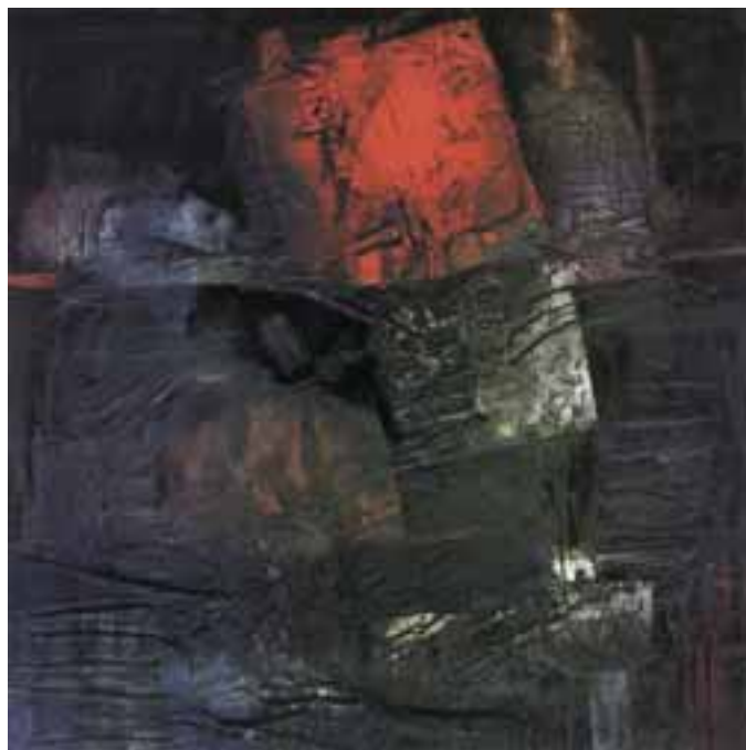
Kollár György: Az enyészet vonzásában , 1984