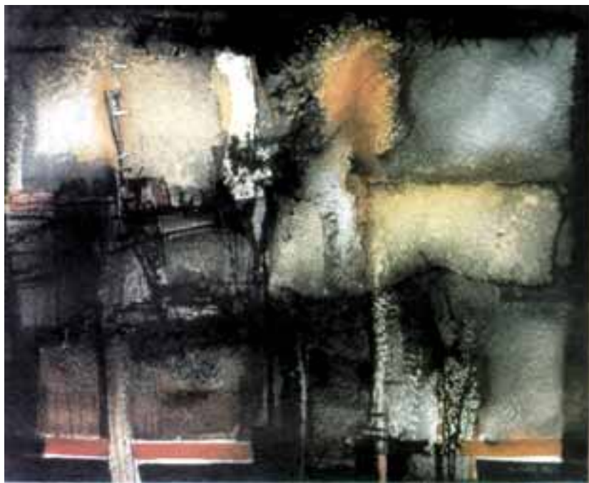
Kollár György: Ipari táj , 1984