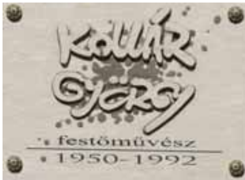
A festőművész emléktáblája, Esztergom, Szentgyörgymező, Dózsa György tér