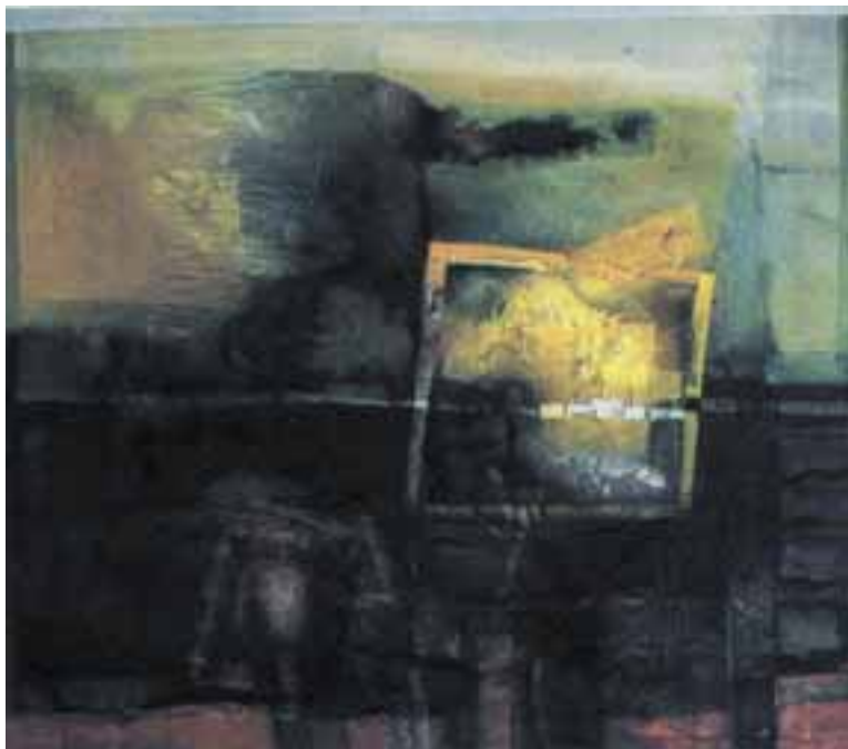
Kollár György: Felperzselt föld , 1984