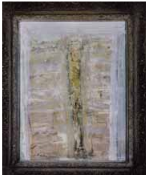
Kollár György: Disseni Krisztus, 1988