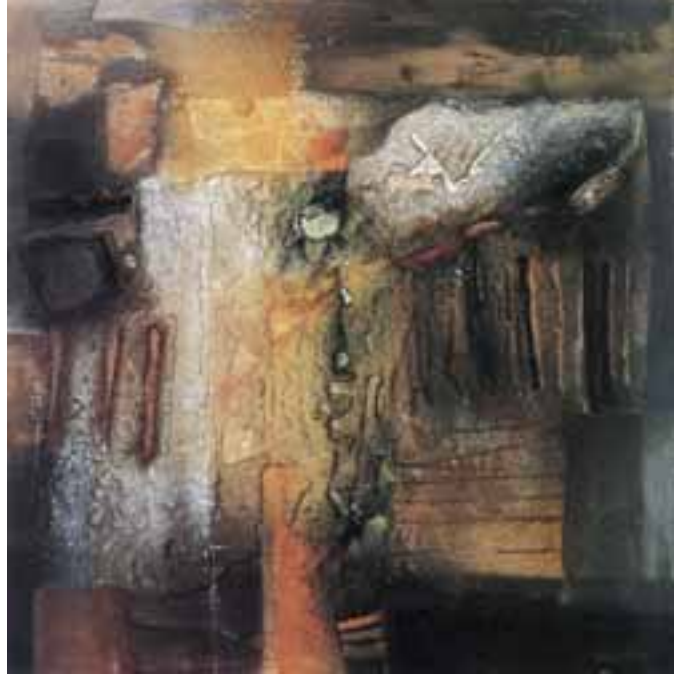
Kollár György: Maradványok , 1984