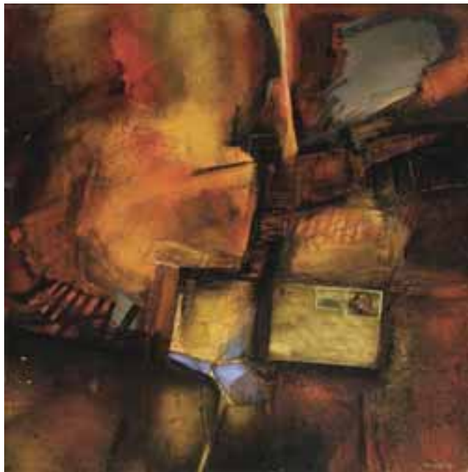
Kollár György: Válaszlevél , 1980