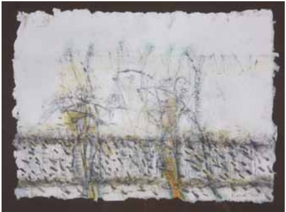
Kollár György: Útszéli jegyzetek , 1985