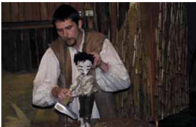
Terülj terülj asztalkám, 2006, R: Nagy Regina, T: Bodor Judit