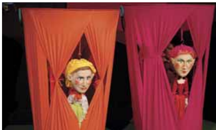
A Tökmag és a Hórhorgas , 2012, R: Nagy Regina, T: Bodor Judit