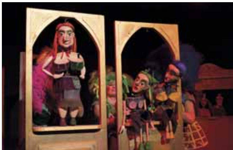
Hamupipőke , 2016, R: Nagy Regina, T: Bodor Judit, Bérczi Katalin, Z: Nagy Csongor