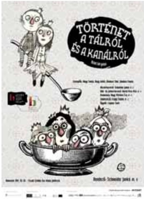
Történet a tálról és a kanálról, 2017, R: Schneider Jankó, T: Bartal Kis Rita, Z: Capp Ferenc