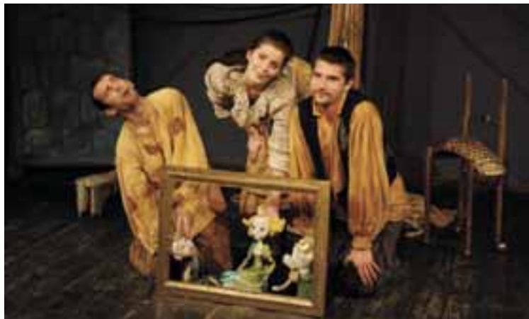
Az égig érő fa , 2009, R: Nagy Regina, T: Bodor Judit