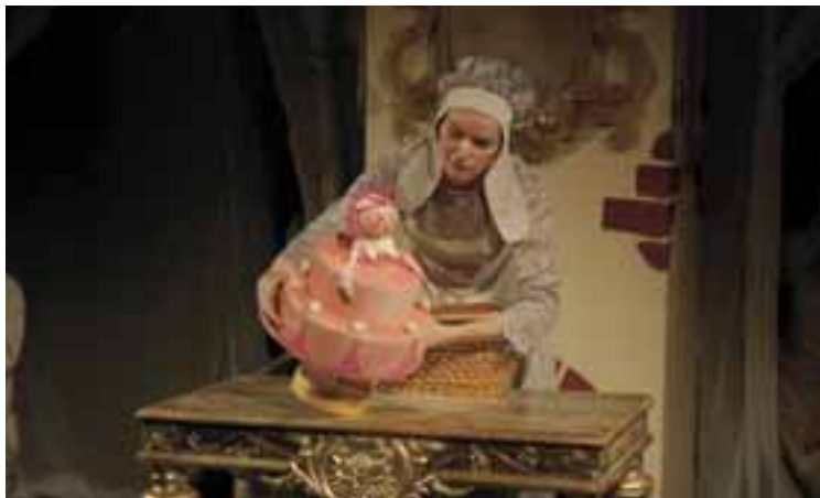
Majolenka hercegkisasszony, 2013, R: Nagy Regina, T: Bodor Judit