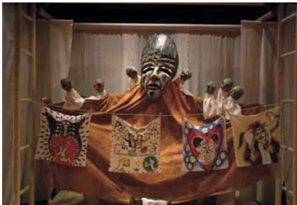
Suttogó fűzesek, 2007. R: Kovács Géza, T: Boráros Szilárd. Mesebolt Bábszínház