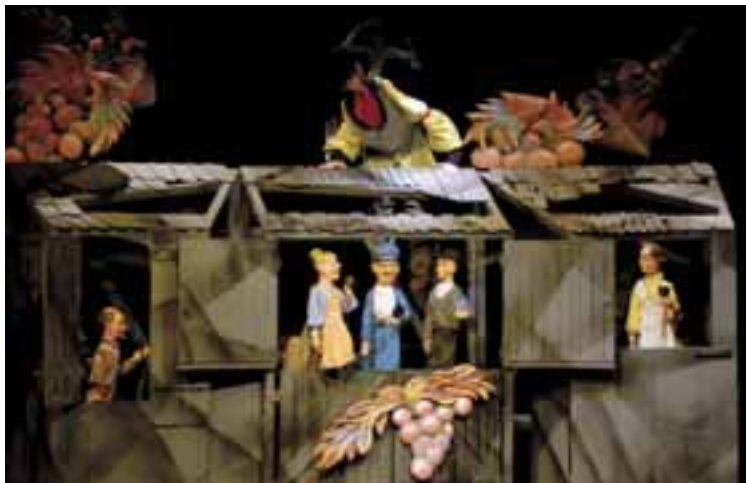
Az ördög sziklája, 2009. R: Kovács Géza, Báb- és díszlettervező: Boráros Szilárd. Vojtina Bábszínház