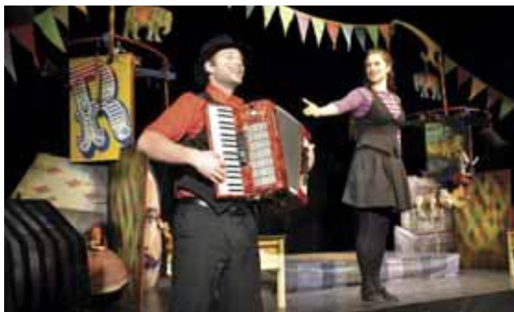
Dobronka cirkusz világszám, 2014. Írta és rendezte: Boráros Milada T: Boráros Szilárd. Mesebolt Bábszínház és Magamura Alkotóműhely