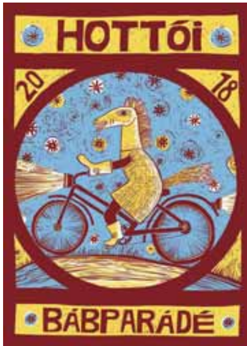
Boráros Szilárd és a hottói bábparádé