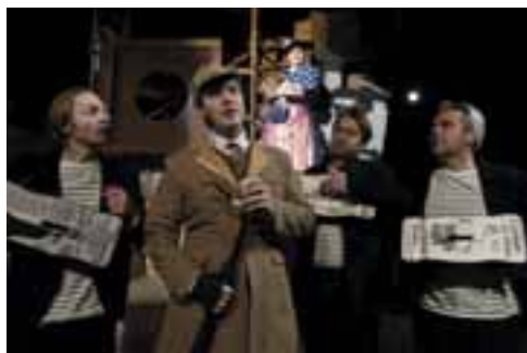
Sherlock Holmes vagy a londoni szociopata esete, 2019. R: Jakub Nvota, Díszlet-, jelmez és bábtervező: Boráros Szilárd. Staré divadlo Karola Spišáka, Nyitra

– Miladával színházban találkoztunk, huszonegy éve vagyunk együtt, három lányunk született. Apósom épp most bevállalta őket egy hónapra, mi meg úgy döntöttünk, hogy ketten fölkerelkedünk, és elmegyünk egy hónapra Ázsiába. Csavarogni – aztán ki tudja, mi lesz belőle. Én most voltam ötven, ő negyven, ezt az utazást kaptuk a családtól ajándékba. Néha nehéz elválasztani a szakmát a magánélettől, bár alapvetően törekszünk rá. Ez is folyamatosan pulzál, mozgásban van. Hottót pedig tudatosan építjük abban az értelemben, hogy figyelünk arra: ne csak szakmabeliekkel sűrűsödjünk itt össze. Ettől függetlenül sűrűsödünk folyamatosan.