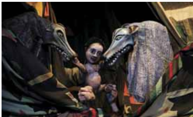
A dzsungel könyve, 2006. R: Kovács Géza, T: Boráros Szilárd. Griff Bábszínház