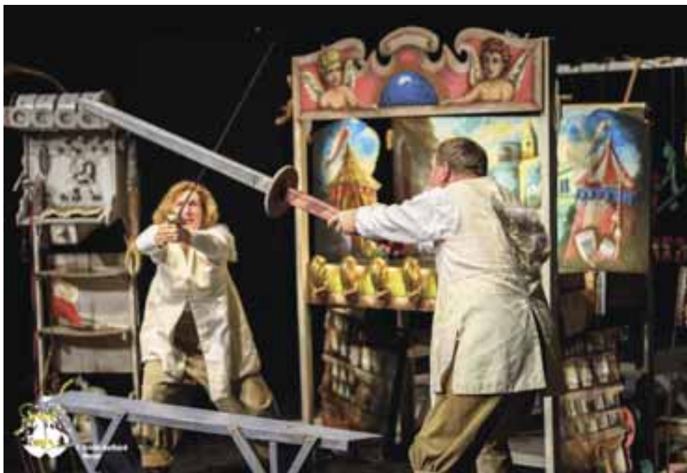
Hős Miklós , 2015. Rendezte és a játékot kitalálta: Vajda Zsuzsanna és Pilári Gábor, Báb- és díszlettev. Boráros Szilárd. MárkusZínház