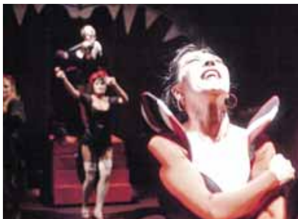
Kádár Kata-revü, 2007. R: Tengely Gábor, T: Boráros Szilárd. Vaskakas Bábszínház