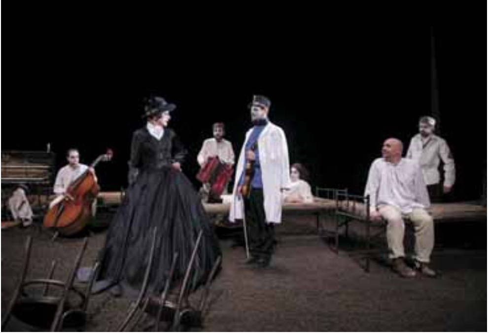
Josef Švejk, 2019. Rendező: Jakub Nvota, Díszlet és jelmez: Boráros Szilárd. Divadlo Aréna, Pozsony