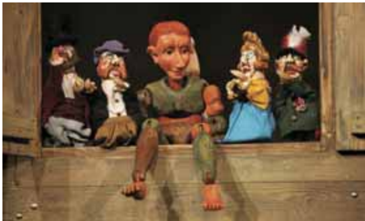
Szindbád, 2005. Rendező: Veres András, Tervező: Boráros Szilárd. Griff Bábszínház