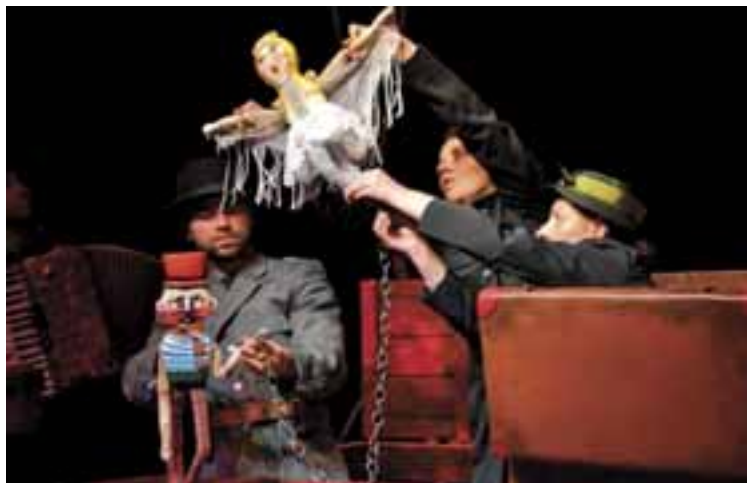
Madarak voltunk, 2012. R: Kovács Géza T: Boráros Szilárd Mesebolt Bábszínház