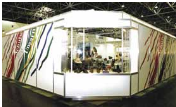
Cipőipari Vásár, Düsseldorf, 1989