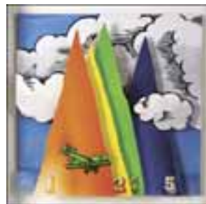
Gyúró István: Számozott üveghegyek az Óperencián innen, a Dunán túl, 2000

(Budapest, Lénia Galéria, 2019. okt. 12. – nov. 12.)