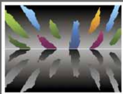
Gyúró István: Eltávozott szeretteink emlékére , 2009