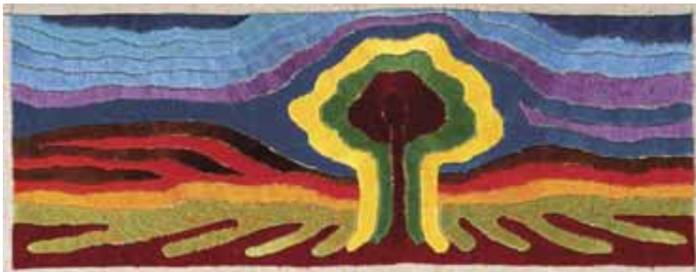
Gyúró István: Életfa , 1977