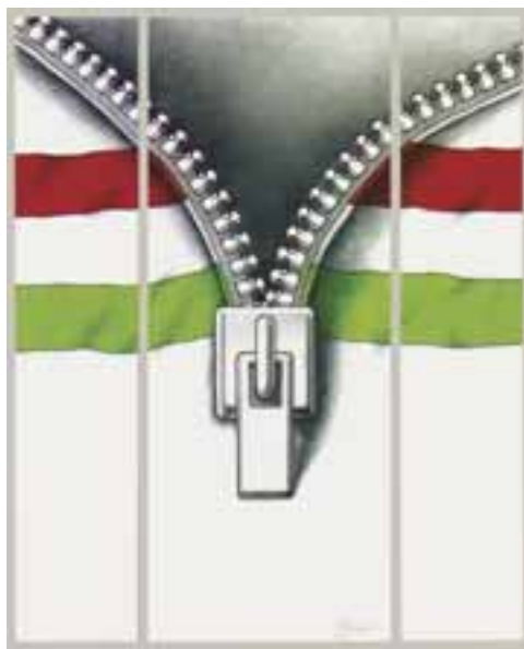
Gyúró István: Sportruházati kiállítás, München, 1987