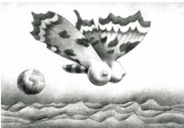
Gyúró István: Science fiction , 1991