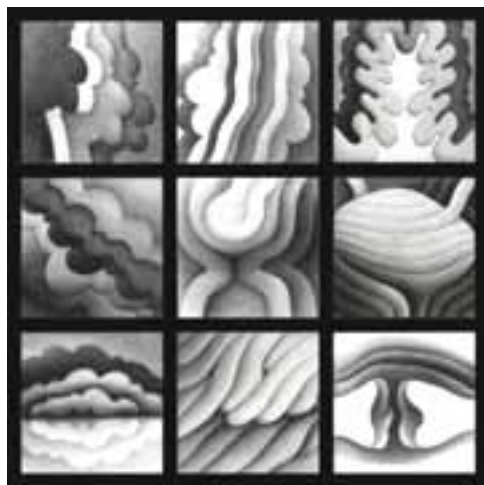
Gyúró István: Egy gyógyszeripari kiállítás képei, 1979