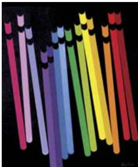
Gyúró István: Irodaszer kiállítás, Hannover, 1985