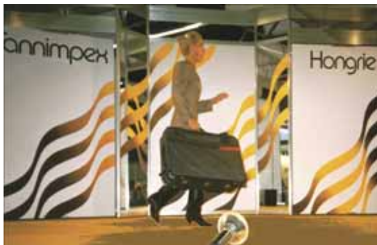
BŐRHÉT – divatbemutató, Párizs, 1988