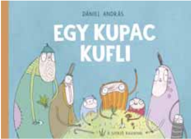
Dániel András: Egy kupac kuffli . Pozsonyi Pagony, 2013