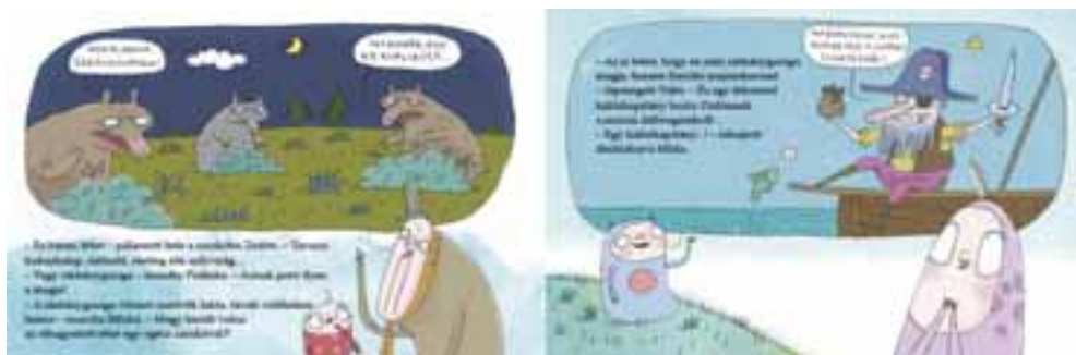
Dániel András illusztrációi – kuffikönyv-oldalak