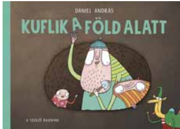
Dániel András: Kufflik a föld alatt . Pozsonyi Pagony, 2019