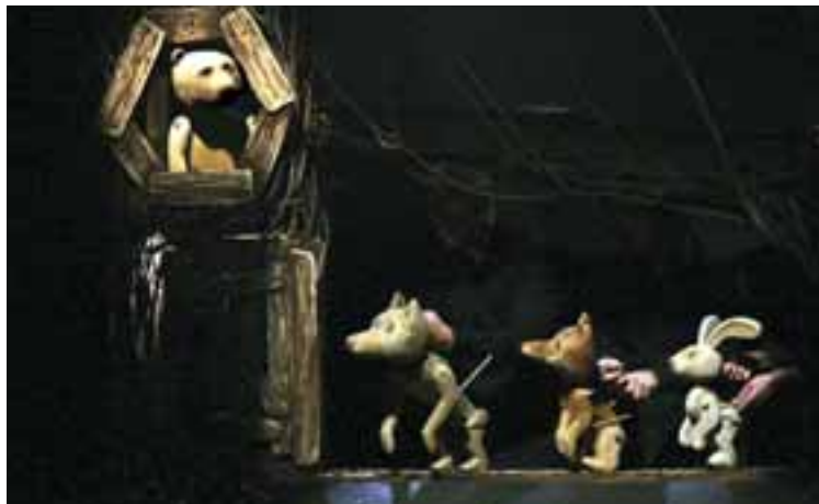
Spliti Városi Bábszínház: Az ellopott Nap. Rendező: Tamara Kučinić, Díszlet- és bábtervező: Alena Pavlović.