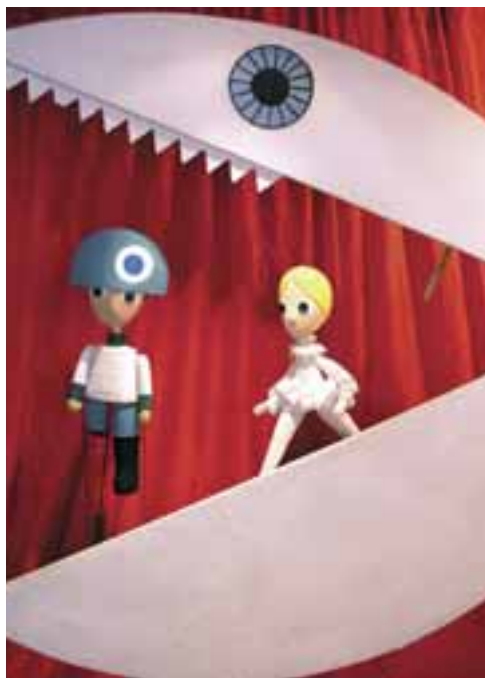
Zadari Bábszínház: A rendíthetetlen ólomkatona . Rendező: Luko Paljetak, Díszlet- és bábtervező: Branko Stojaković.