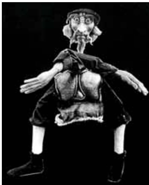
Zadari Bábszínház: Don Quijote . Rendező: Wiesław Hejno, Díszlet- és bábtervező: Mojmir Mihátov