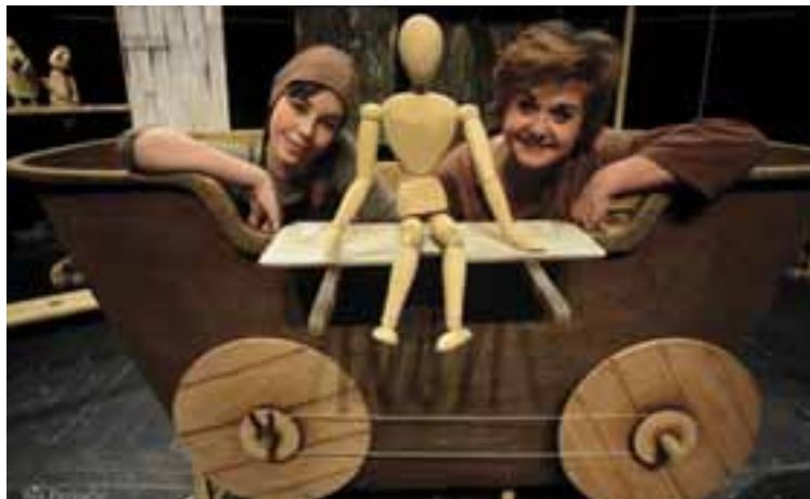
Zadari Bábszínház: A zseniális zseni. Rendező: Tamara Kučinović, Díszlet- és bábtervező: Gulnaz Fatykhova.