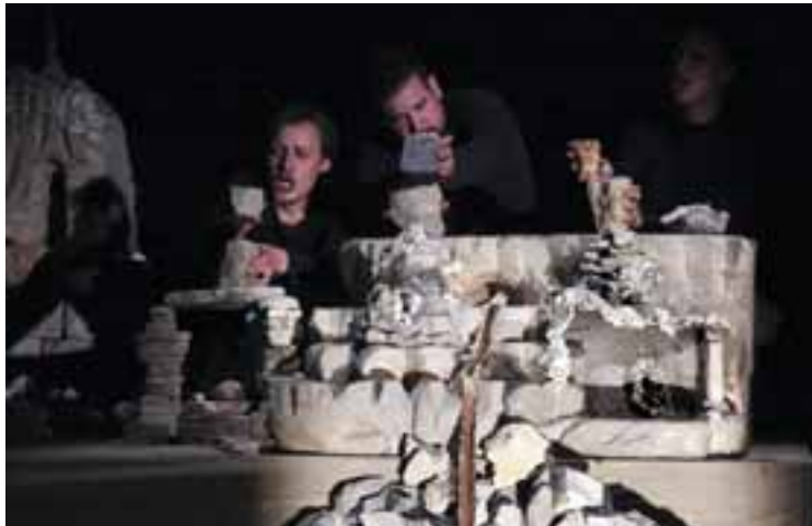
Művészeti és Kulturális Akadémia, Eszék: A szívánvány