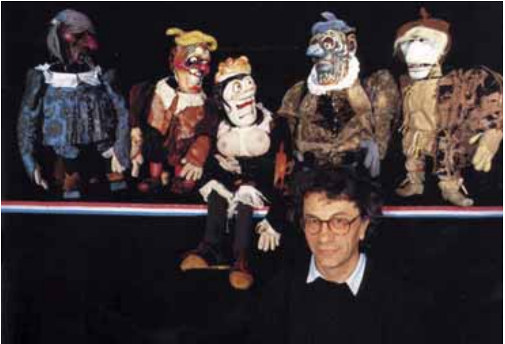
Zágrábi Ifjúsági Színház: Pathelin mester . Rendező, díszlet- és bábtervező: Zlatko Bourek