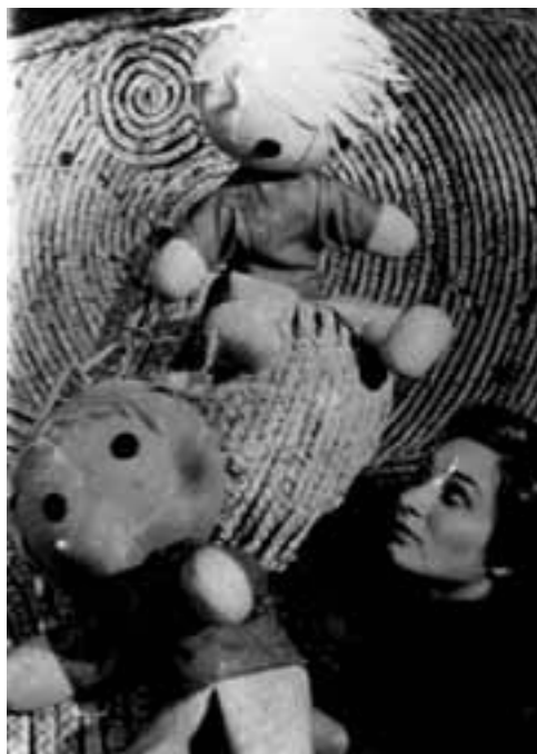
Zadari Bábszínház: Botafogo . R: Edi Majaron. Díszlet és bábtervező: Branko Stojaković