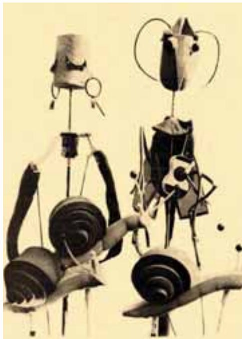
Zágrábi Bábszínház bábjai. Tervező: Berislav Deželić