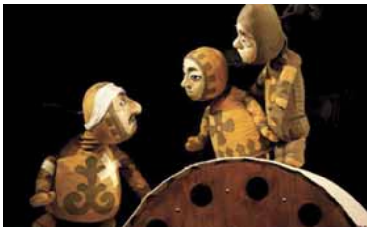
Split Városi Bábszínház: Hogyan szállt le a Szél az emberekhez? Rendező: Tamara Kučinović, Díszlet- és bábtervező: Liubov Namukhambetova