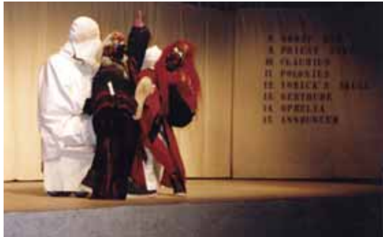
Tizenötperces Hamlet Rendező: Zlatko Bourek