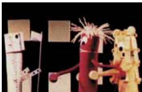
Zágrabi Bábszínház: Óz, a nagy varázsló . Rendező: Davor Mladinov, Díszlet- és bábtervező: Berislav Deželić