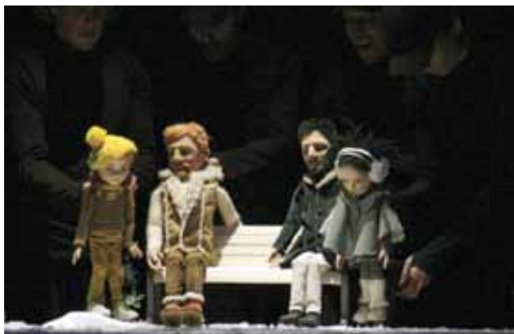
Rijekai Városi Bábszínház: A megfagyott dalok. Rendező: Tamara Kučinić, Díszlet- és bábtervező: Alena Pavlović.