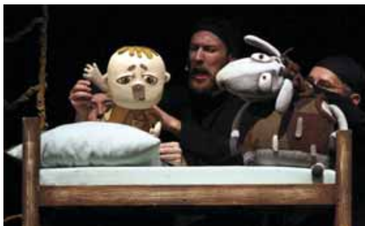
Eszéki Branko Mihaljević Gyerekszínház: A kilencedik bárány. Rendező: Liudmila Fedorova, Díszlet- és bábtervező: Natalia Bumos.