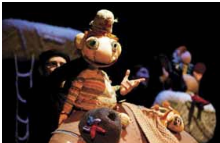
Branko Mihaljević Gyerekszínház (Eszék): A jó Doktor Jajdefáj. Rendező: Tamara Kučinović, Díszlet- és bábtervező: Volha Balashova