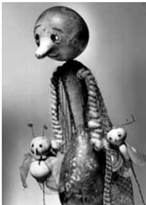
Vlasta Pokrivka bábfigurái