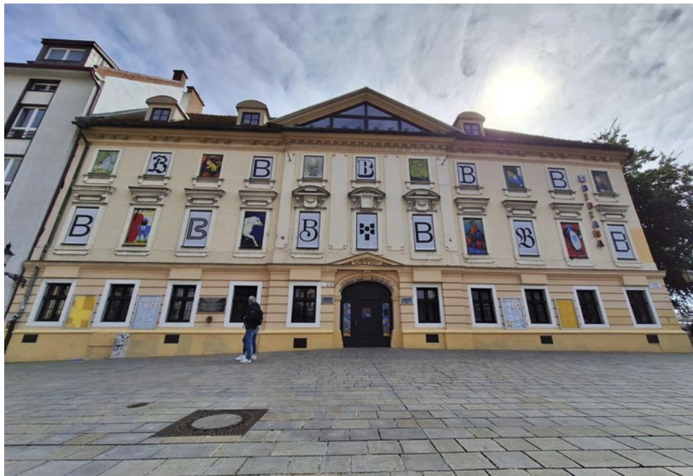
A BIBIANA épülete