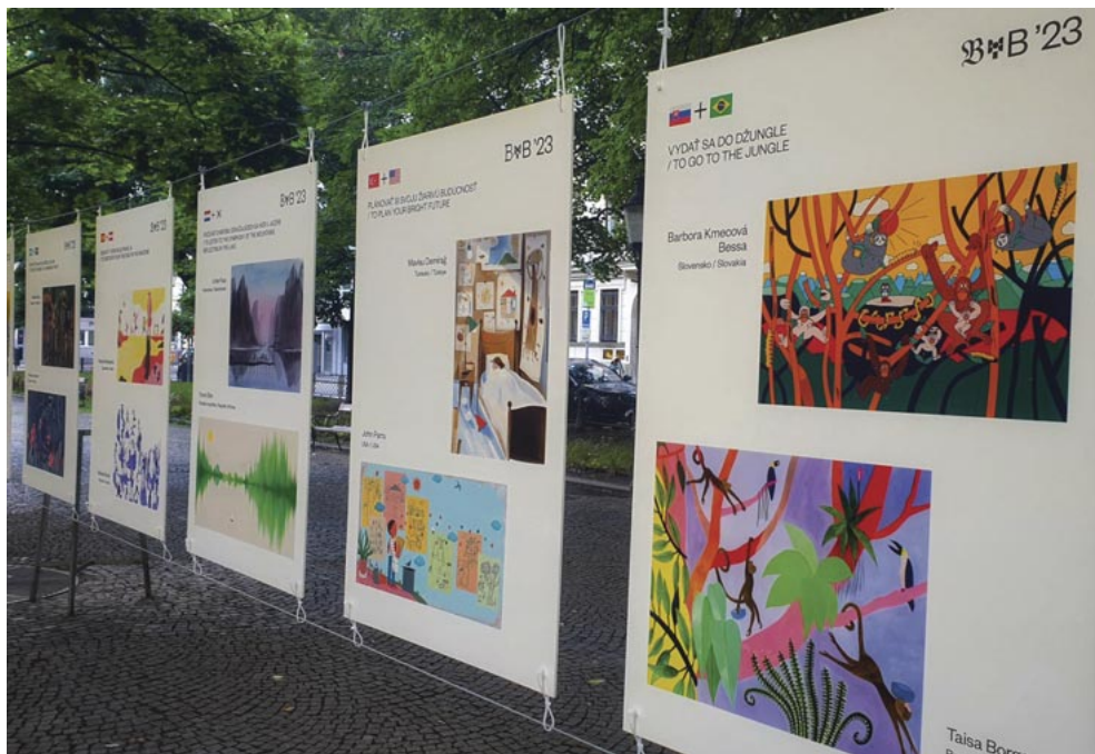
Ami összeköt bennünket (Čo nás spája) – a pozsonyi szabadtéri kiállítás