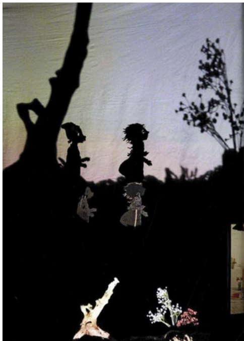
A kivilágított éjszaka (La notte illuminata), 2006