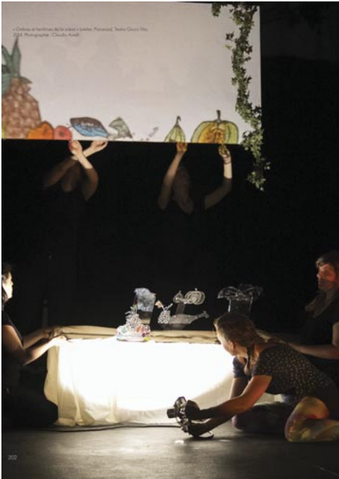
Ombres et fantomes de la scène (A színpad árnyékai és szellemei), 2014. Teatro Gioco Vita.