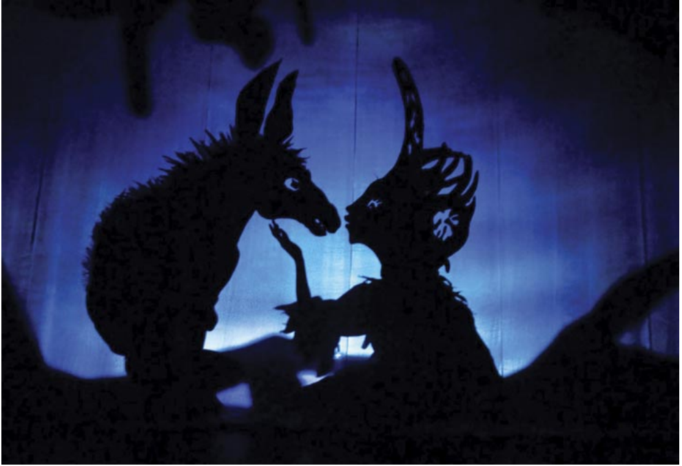
Szentivánéji álom (Le Songe d'une nuit d'été). Rendező: Fabrizio Montecchi, 2011.