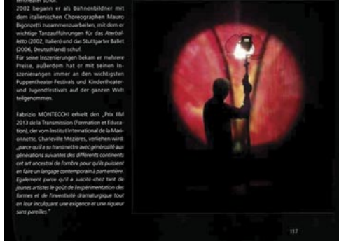
Részletek a könyv zárófejezetéből, Montecchi-életrajzzal.