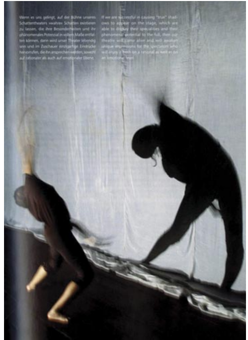
Részlet Montecchi könyvéből