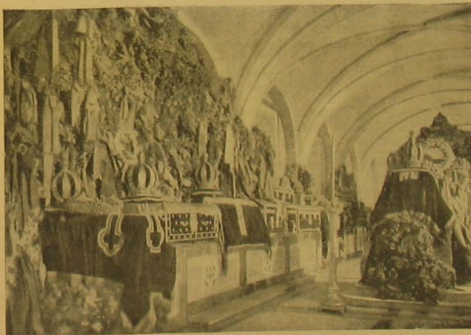
A portugál királyok temetőjének helye a San Vicente do Fora templomban.