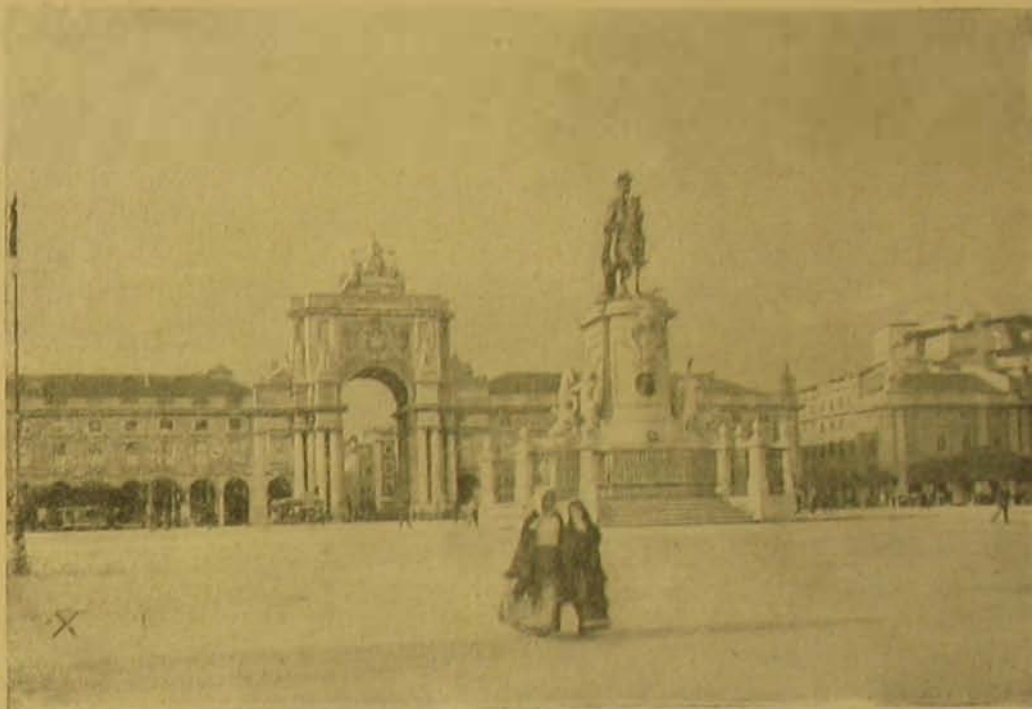
A Praça do Comercio (a királygyilkosság az X-el megjelölt helyen ment végbe).