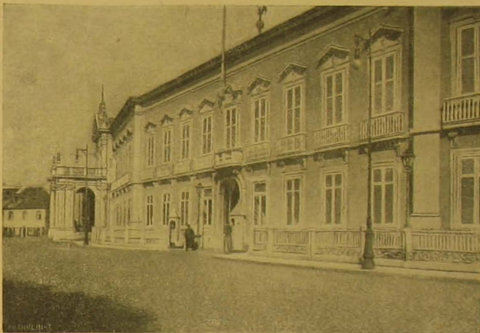
A Necessidades királyi palota, a hova indultában a királyt megölték.