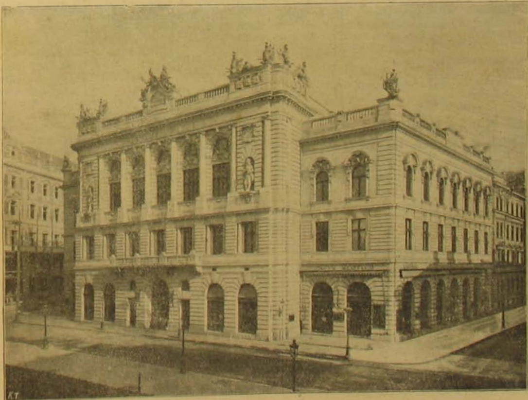
A budapesti katonatiszti kaszinó. — A budapesti katonatiszti kaszinó épülete.