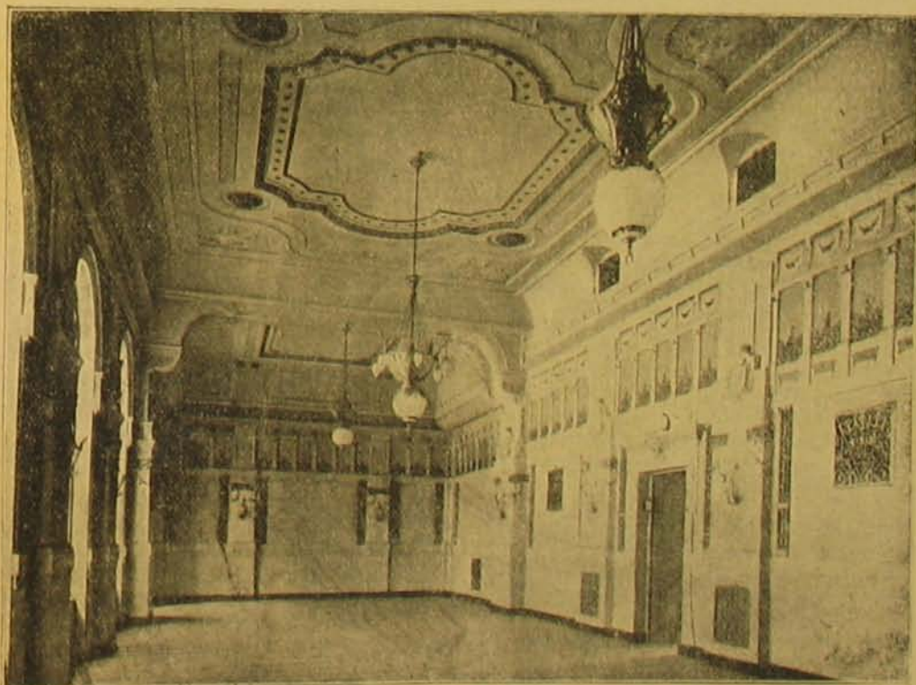
A budapesti katonatiszti kaszinó. Folyvasó terem.