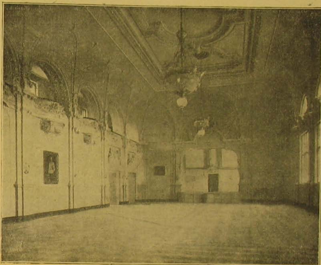
A nagy díszterem.