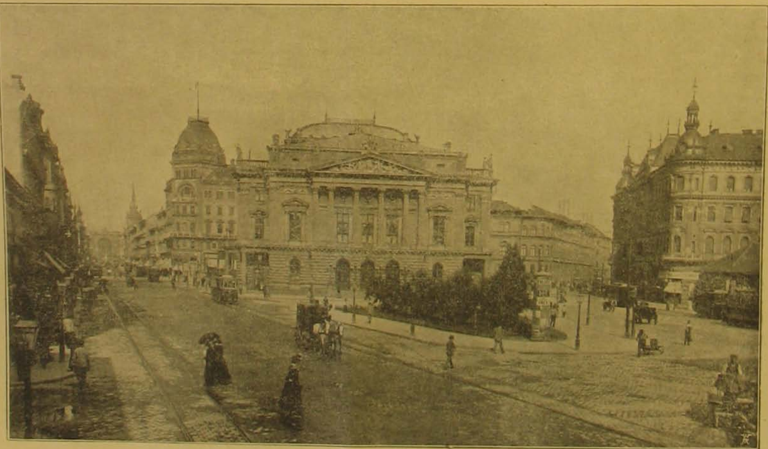
A Népszínház épülete, melybe a Nemzeti Színház költözni fog.