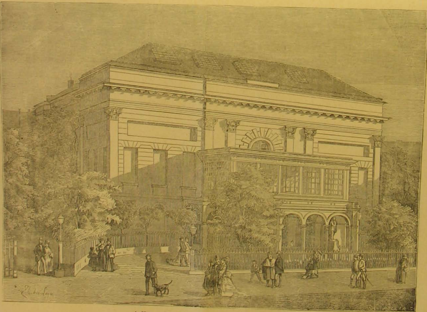
A Nemzeti Színház épülete az 1840-es években.