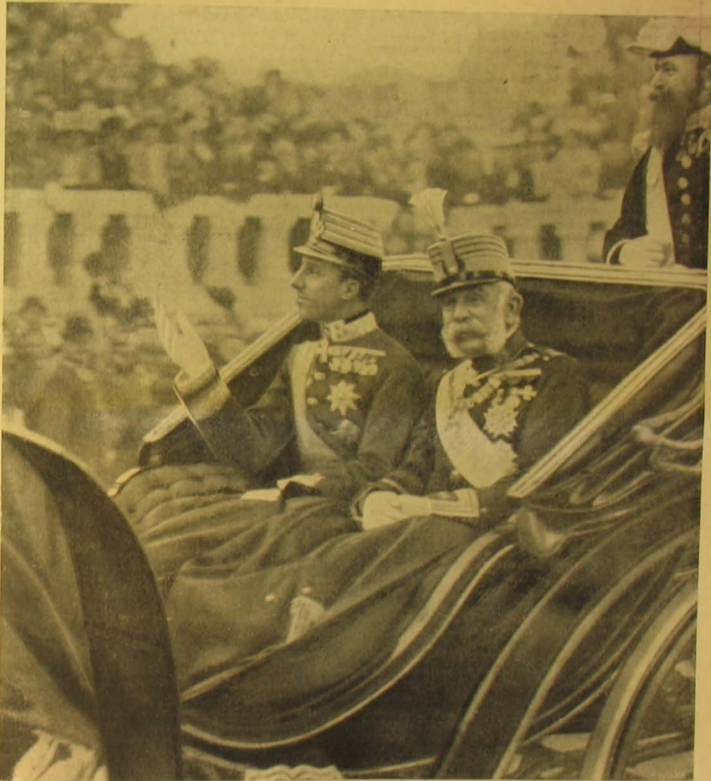
XIII. Alfonso spanyol király királynék oldalán bevonul Budapestre.