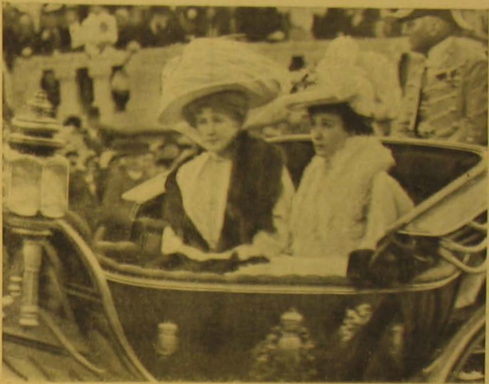
Esa királyné Mária Annunciata főhercegnővel.