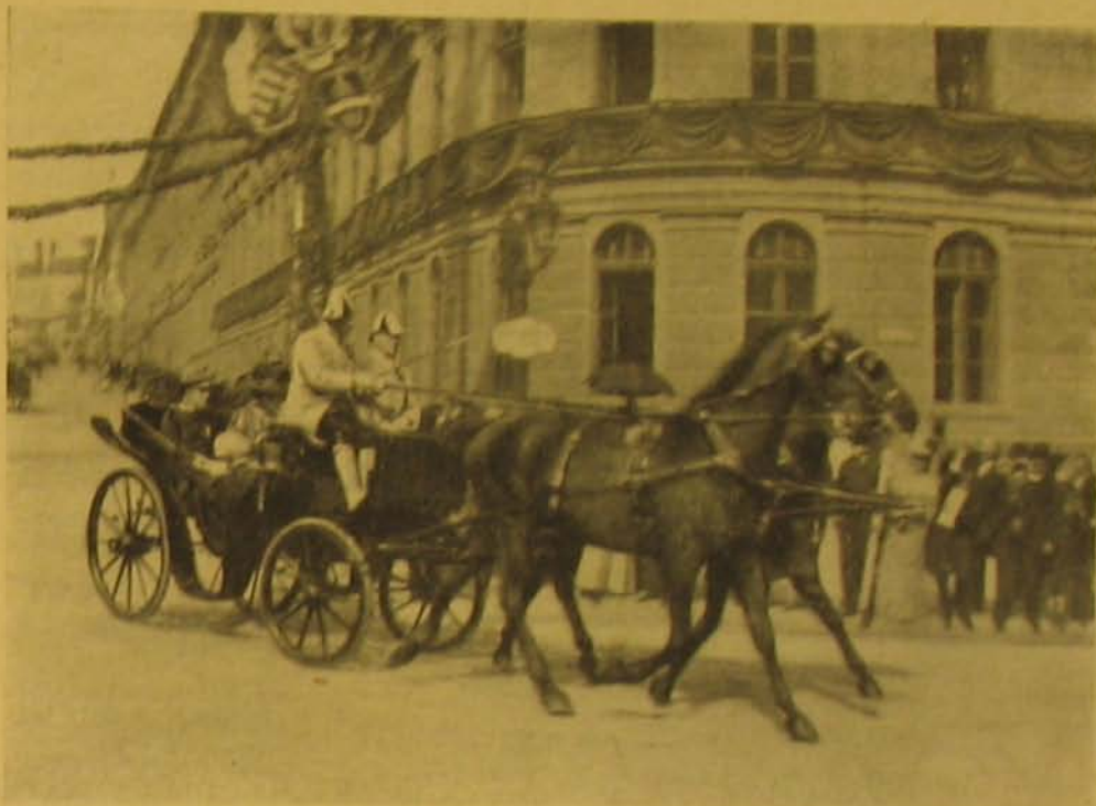
A spanyol királyt pár Budapesten. — A spanyol királyi pár Budapest utcáin, a bevomlás utáni nap.

vizsgálóbíró ugyan ilyen végzése ellenére is, szabadlábra helyezte az illetőt és úgy ítélkezett aztán felette a törvényszék.