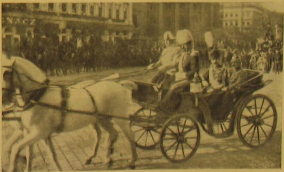
Ferenc Lőrdfnád trónörökös a Spanyol király, bovonulása.