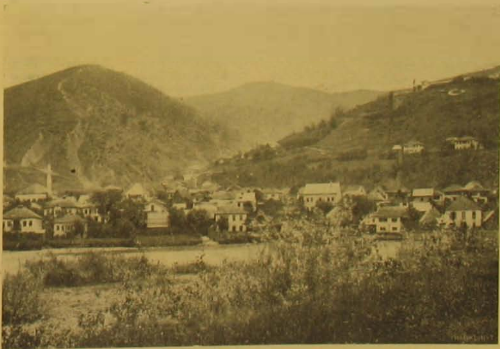
Prijopolje egy része, jobb oldalt fenn a hegyen a török laktanya.