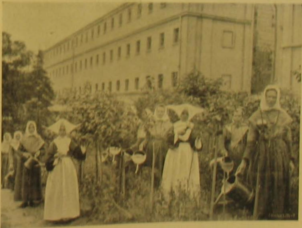
Virágot készülő legyűlés-nők.