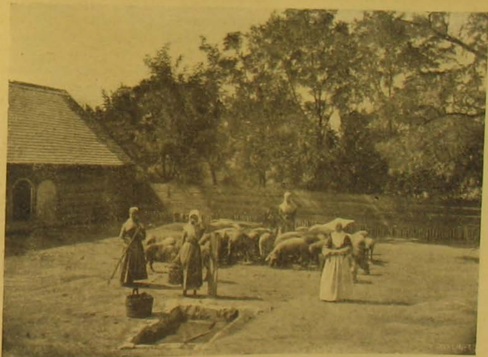
A gazdasági udvar.