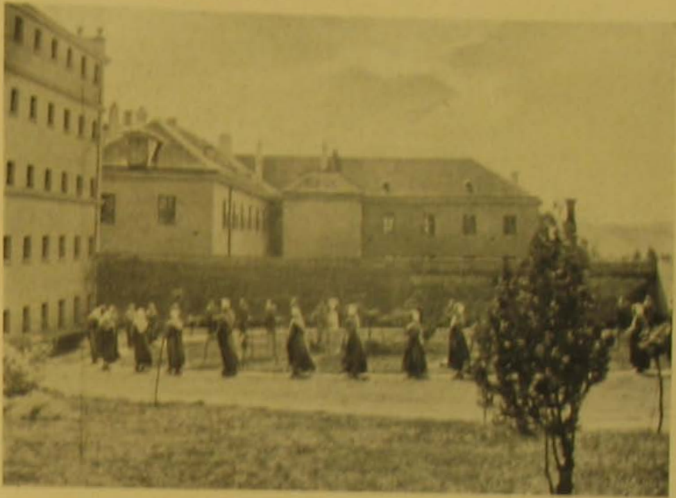
Hétfő a legyűlés udvarán.