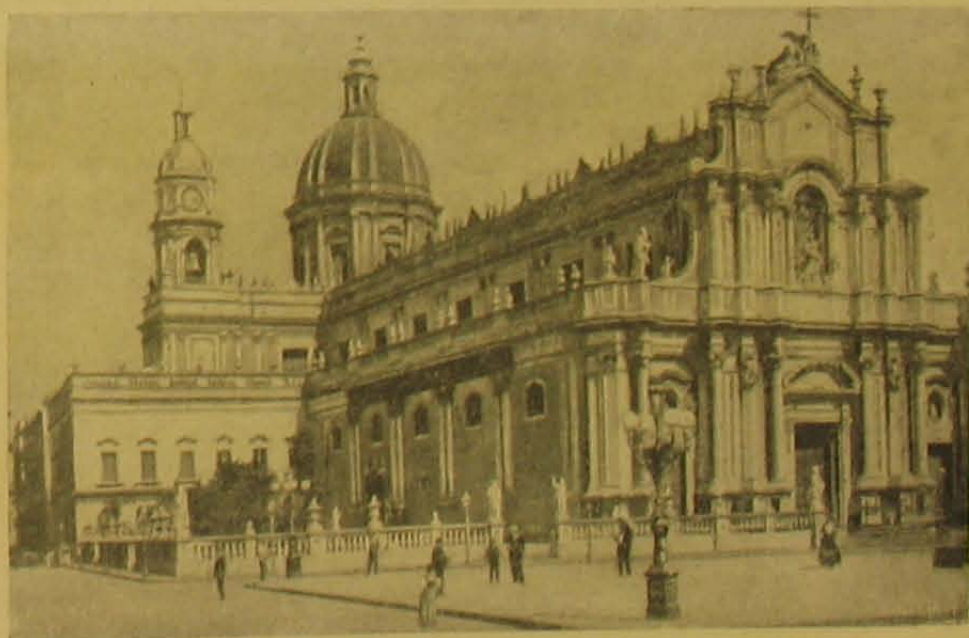
A cataniai székesegyház.

Az olaszországi földrengés színhelyéről.