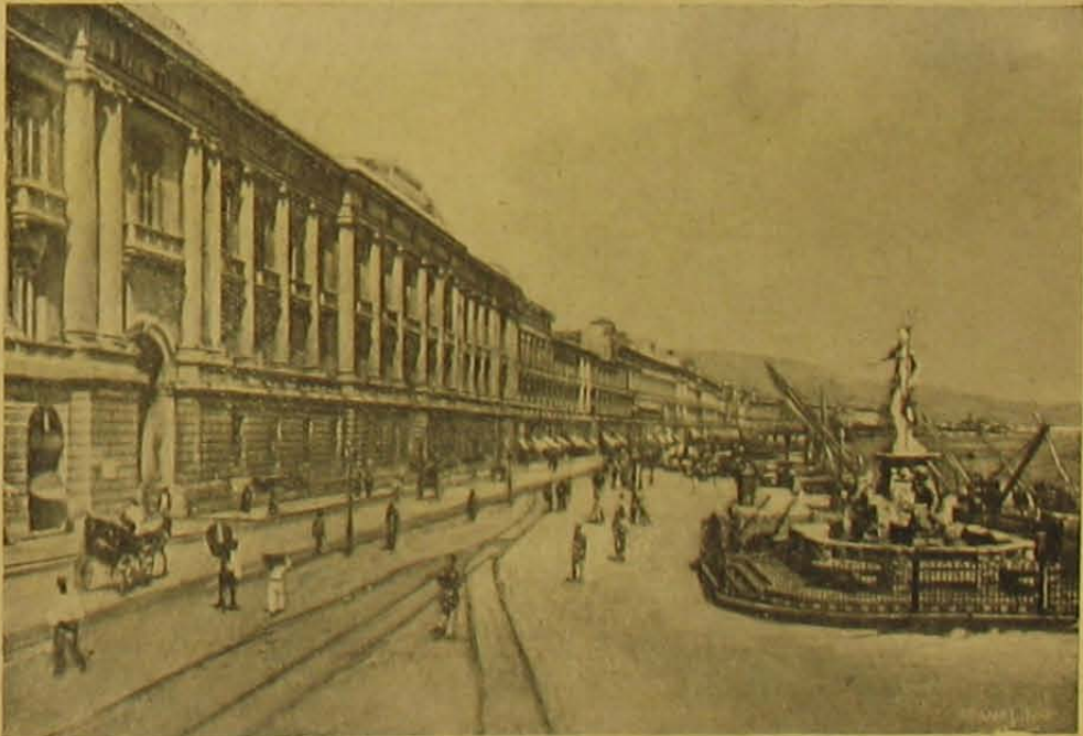
A tengerparti korzó Messinában.

Az olaszországi földrengés színhelyéről.