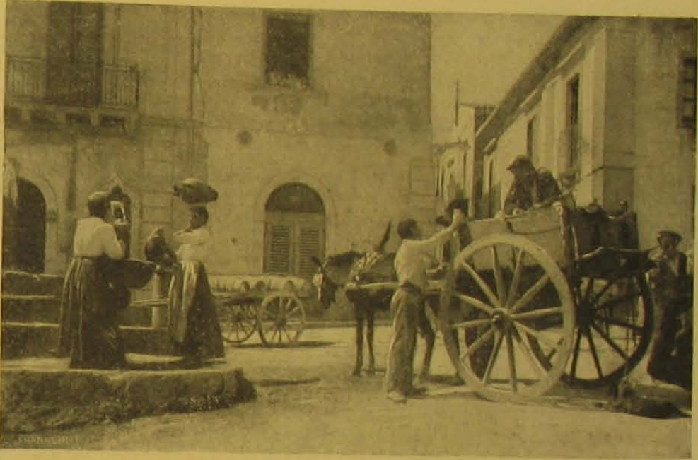
Utcai kép Messinából.