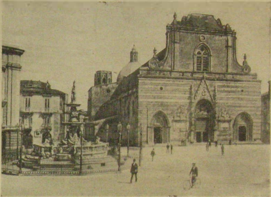
A messinai székesegyház.