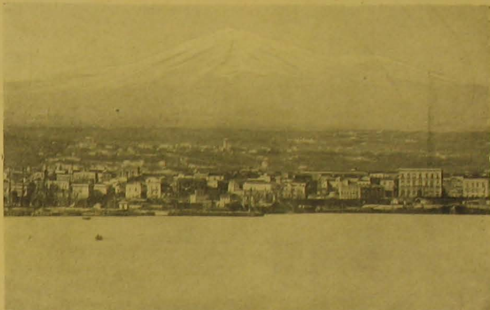
Catania. (Háttérben az Etna.)