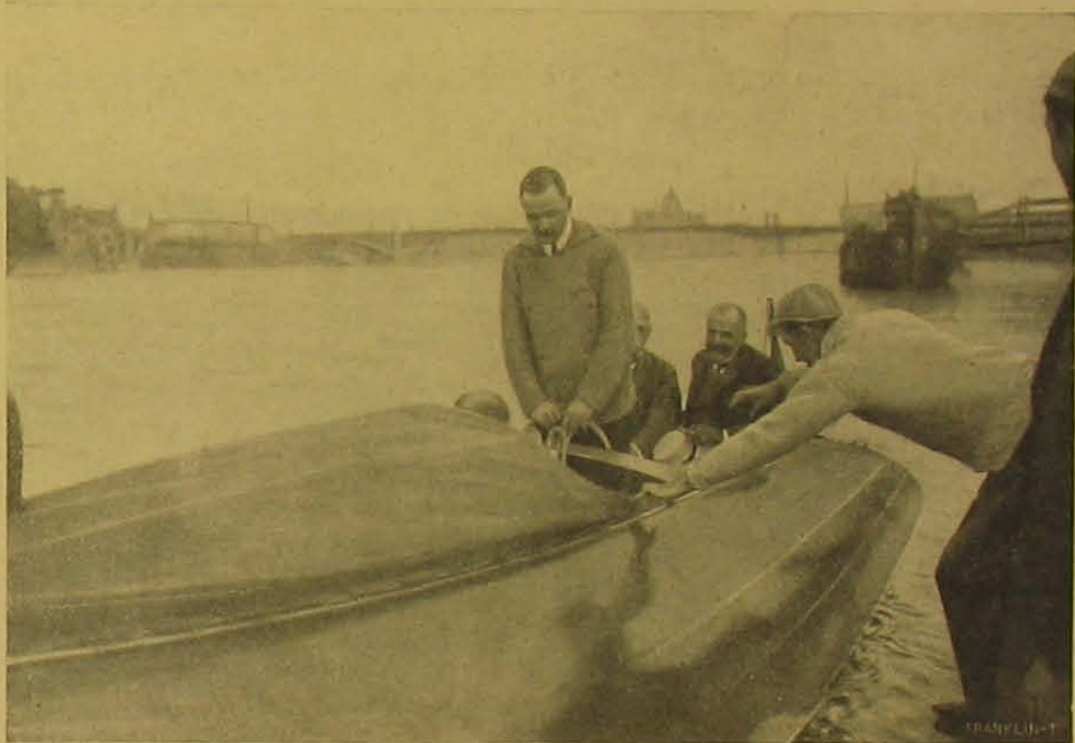
Indulás ; a csónakban Korvin főhadnagy mögött Jekelfalussy honvédelmi miniszter és Fülepp Kálmán főpolgármester.