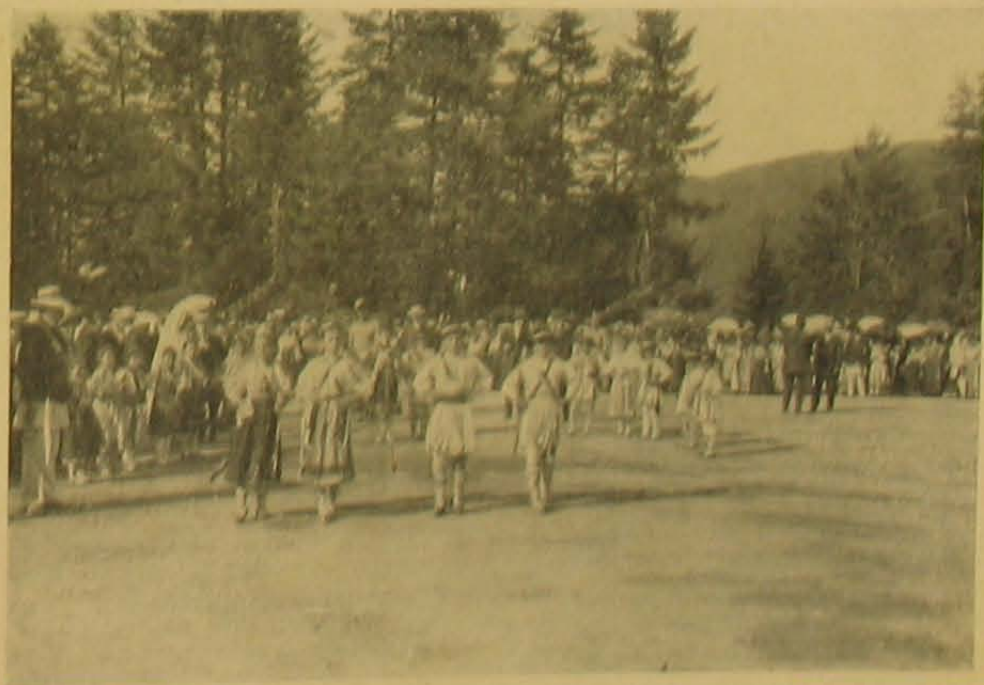
Román nemzeti tánc a népünnepen.