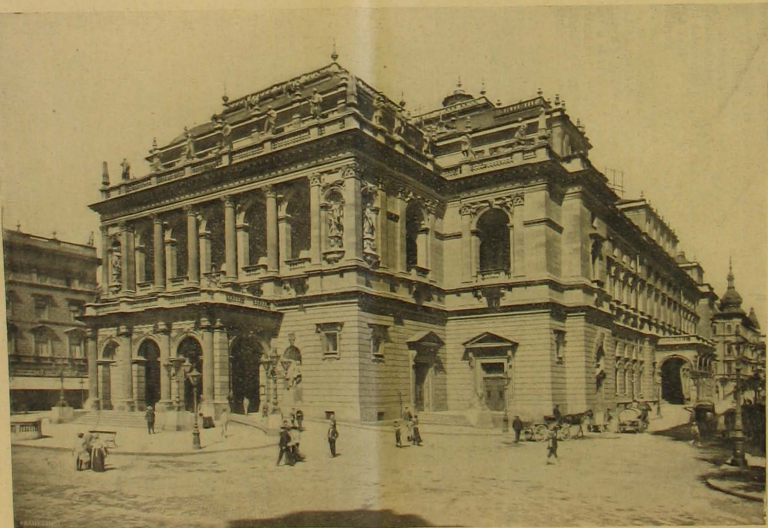
A magyar királyi operaház.