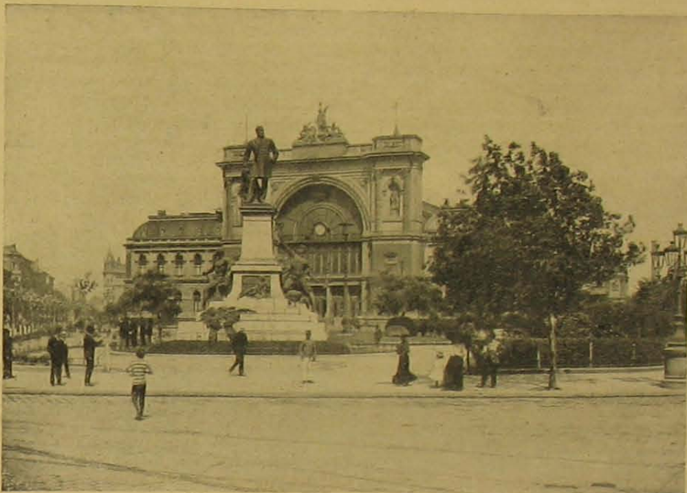
A huszonöt éves keleti pályaudvar.