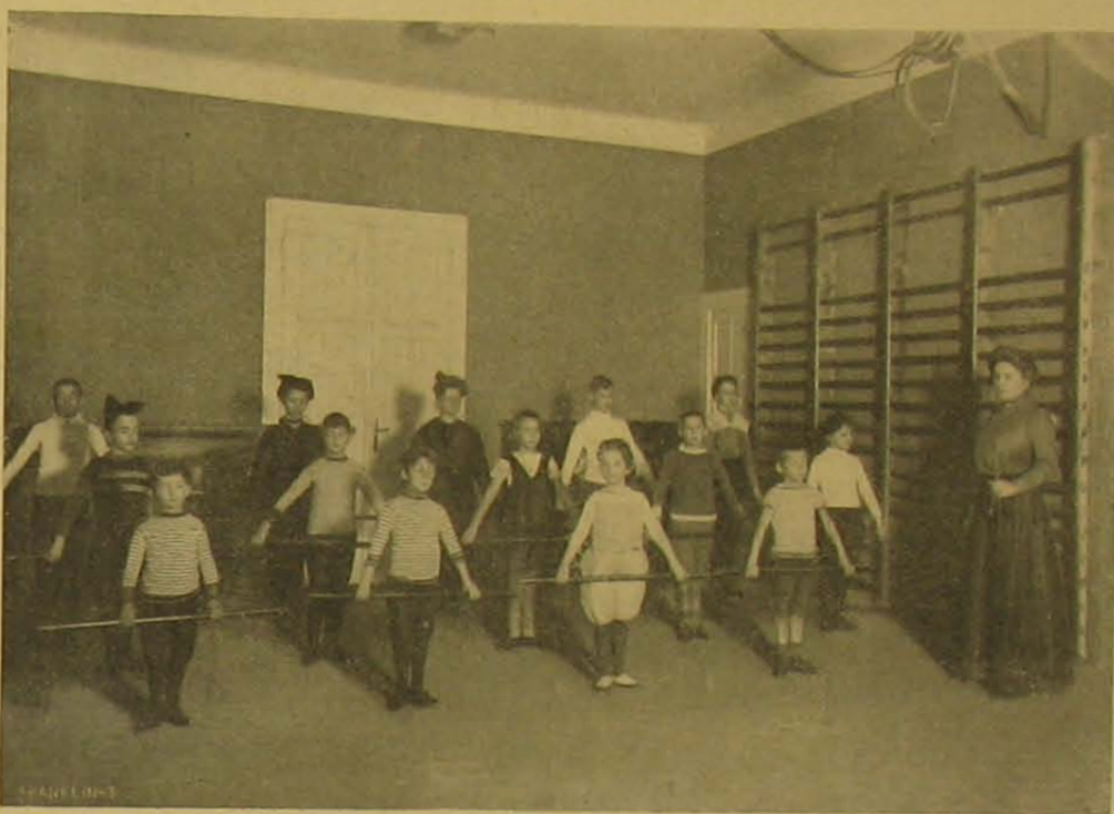
Gyermekek vivó- és tornaiskolája. — Gyakorlat botokkal.

nyei fölött, mi nemsokára annak nagymérvű kivitelében nyilvánult. Az egész középkoron át a német sör virágzású korát élte; a sörfőzők czébe a többiek előtt nagy tekintélyben állott; egyike volt a legjövendőbb foglalkozásoknak. A sörfőzők ép úgy meggazdagodtak, mint napjainkban. A sörfőzők czéhei a 14. században alakultak, védőül a meszeszerű Gambrius vagy Gambrius királyt választották, ki, a monda szerint, Kr. sz. előtt 1200 évvel a sört feltalálta és vele Brabant tartományt boldoggá tette.