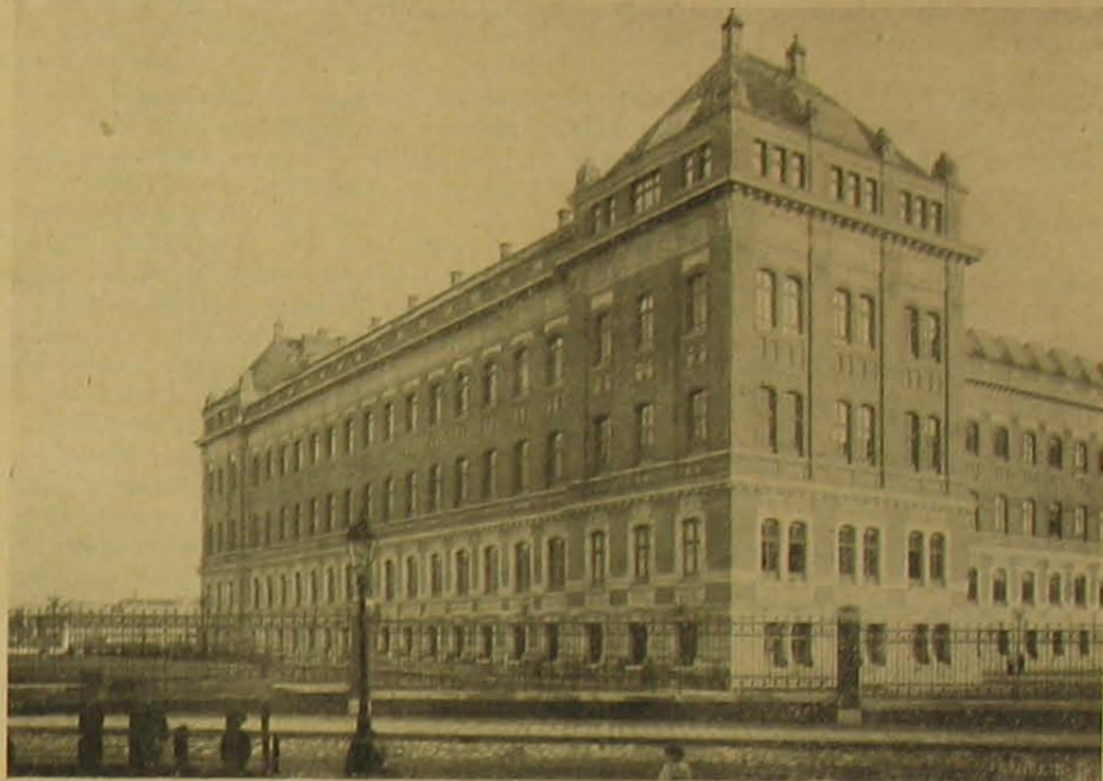
Az új intézetem. — A központi épület egyik szárnyépülete.

férje teljesen megbizott benne s még csak nem is gyanította, hogy a legénnyel viszonya van.