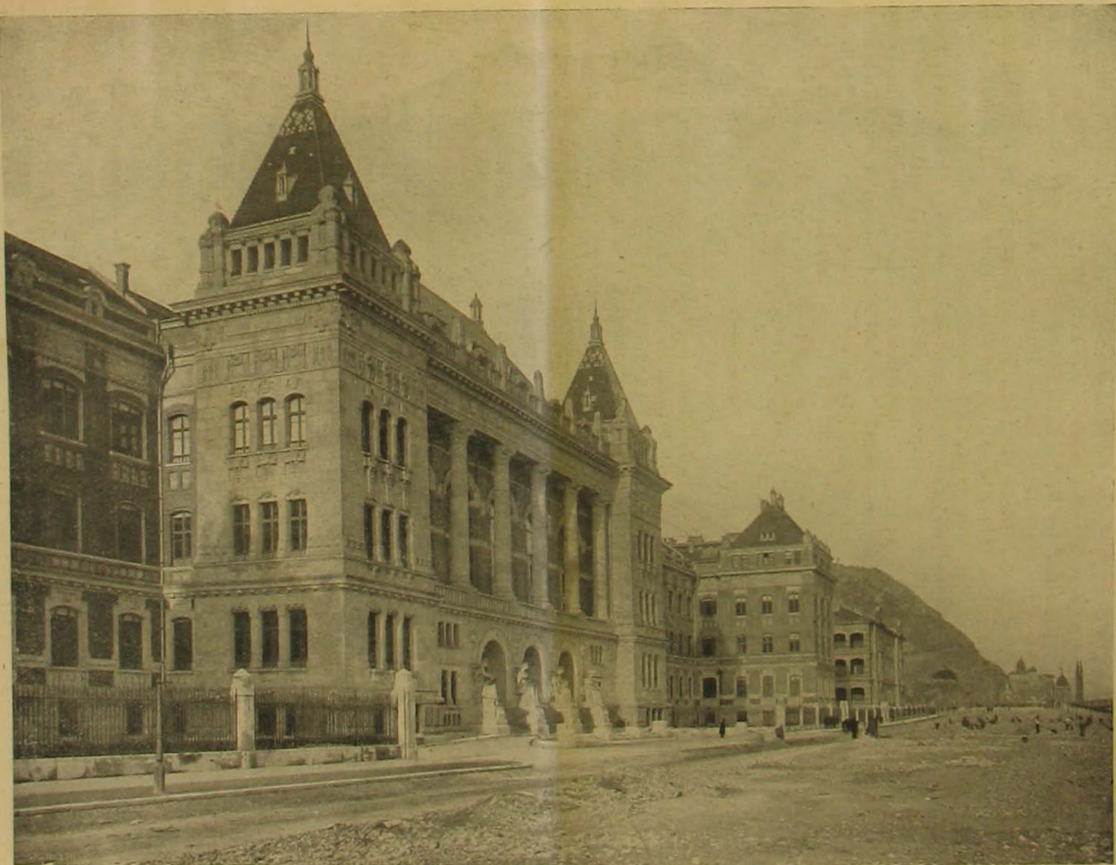
Az új megyetem központi épületének a Dnára néző homlokzata.