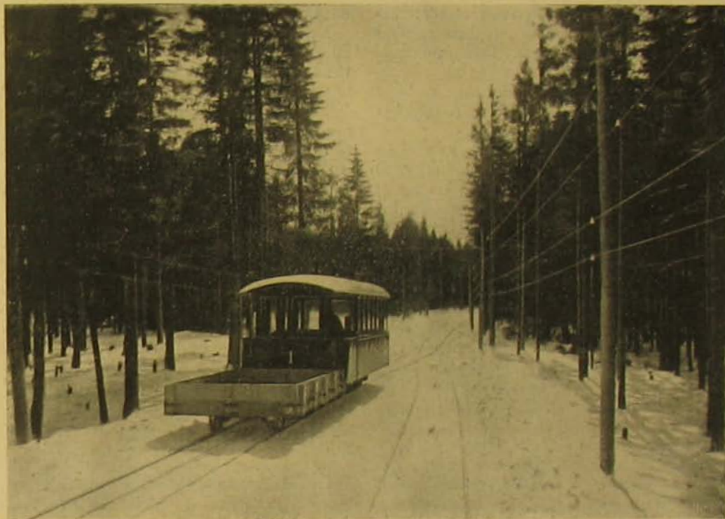
A sikló-vasút egy kocsija a sportezerek számára való pótkocsival.