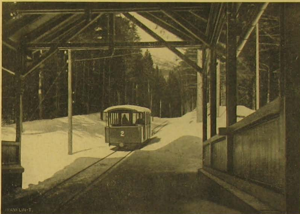
A Tarajkára vivő sikló-vasút alsó állomása.