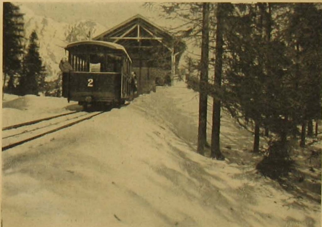
A sikló-vasút felső-állomása a Tatijkévé.