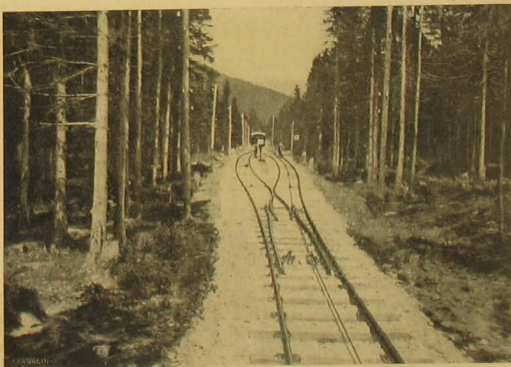
A Tarajkára vivő sikló-vasút kitérője.