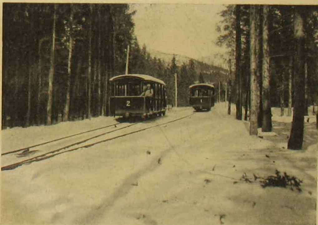
A síklő-vasút kitérője.