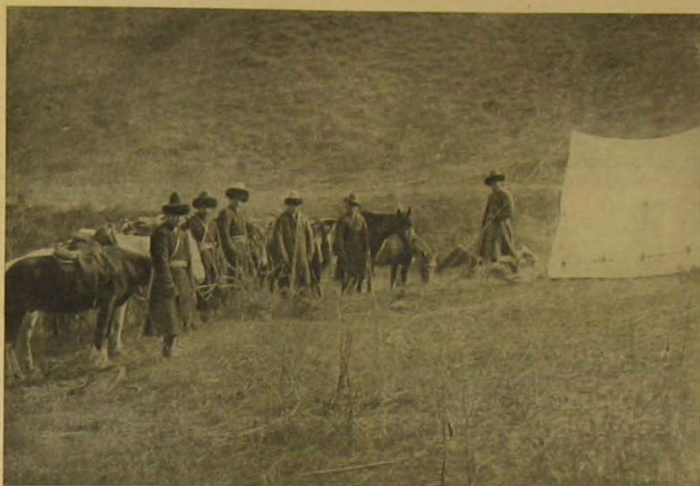
Krinz Gyula karavánja az indulás előtt.