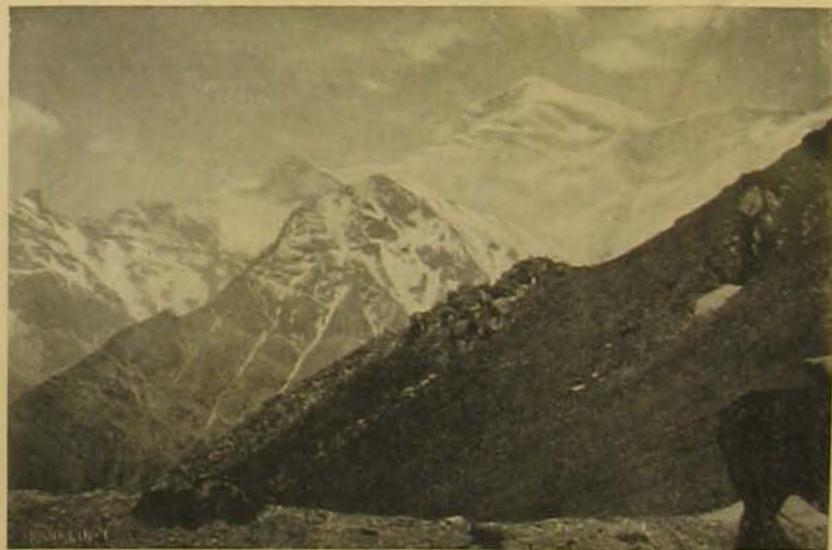
A jéggel borított hegyoldalak.