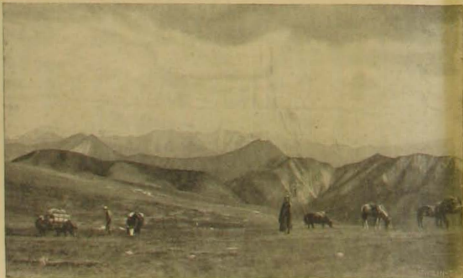
Fenn a «világ tetején».