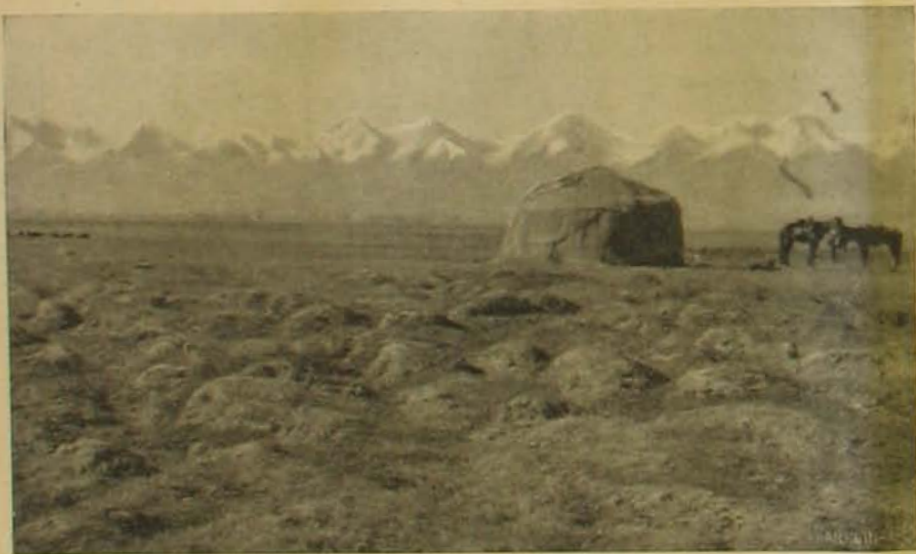
Kilátás a Karazok-völgyből a kászári Alpokra.