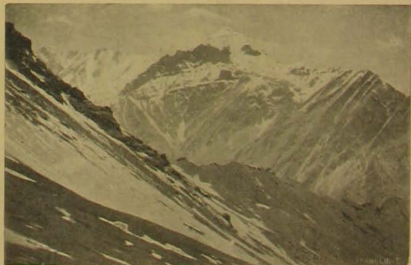
Kilátás az Atojnok hágó oldalából.