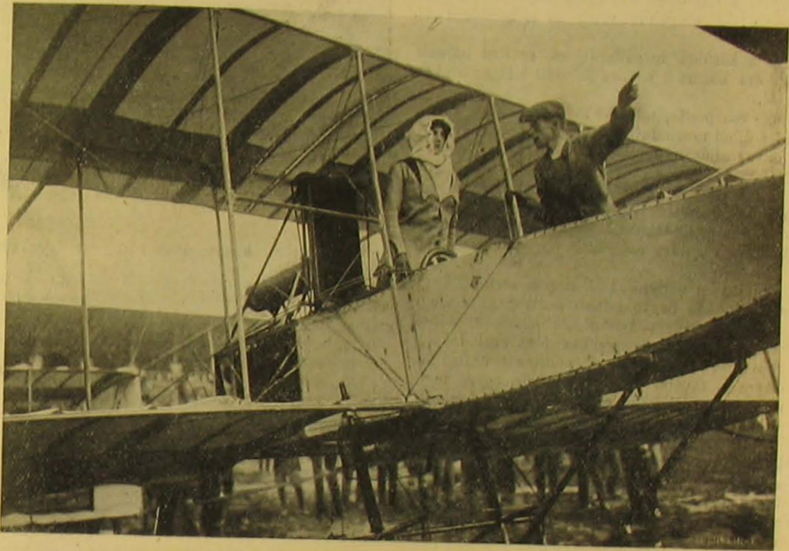
De la Roche-báró és gépésze.