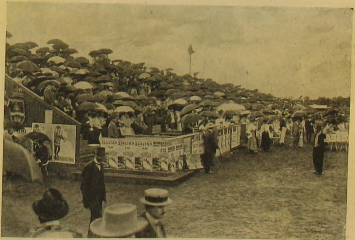
A fecloten tribün áldozatai.