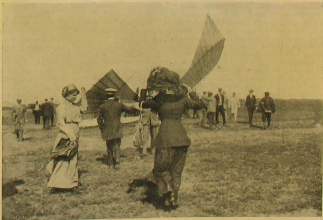
A «Galamb» felborult.

A budapesti nemzetközi repülőtversenyekről.