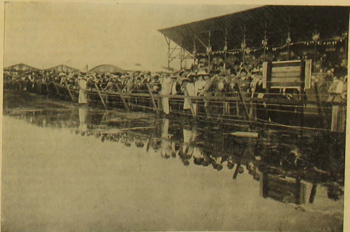
A június 8-iki zápor után.