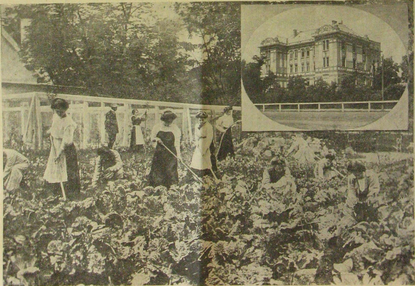
Az Amizoni alapítványi nőnevelő-intézetből. — Az intézet épülete. Kerti munka a veteményes kertben.