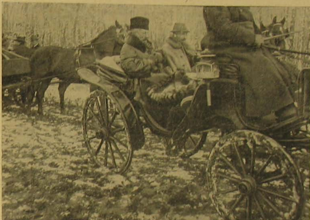
Indulás a vadászatra.