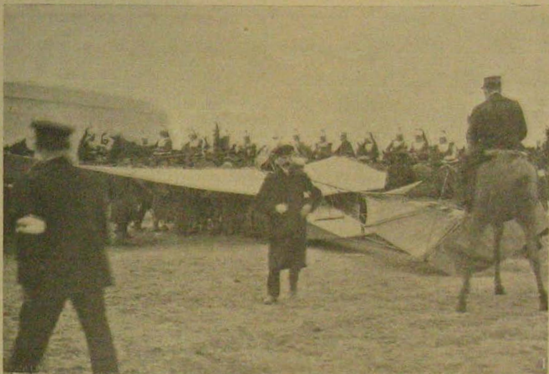
Train lezuhant gépe a szerencsétlenség pillanatában.