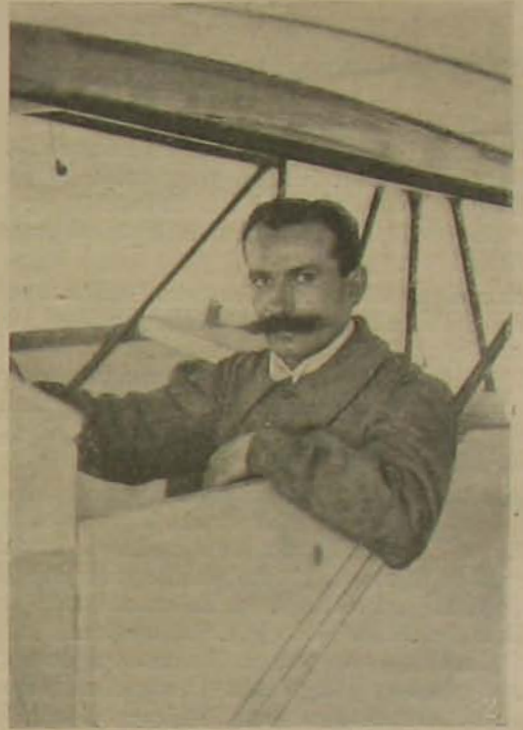
Train aviatikus, a szerencsétlenség okozója.

Egy rettenetes baleset híre hozta izgalomba a közel-múlt vasárnapon a művelt emberiség idegétét. A Páris melletti Issyben történt repülőgép-szerencsétlenség híre volt ez, a mely több súlyos testisértés okozása mellett a francia hadügyminiszter életét is kioltotta. Hiszen a repülőgép-versenyek egész sorozata végződött már kisebb-nagyobb szerencsétlenséggel, sőt a budapesti versenyen éppen hasonló eset történt, csak éppen végeredményében