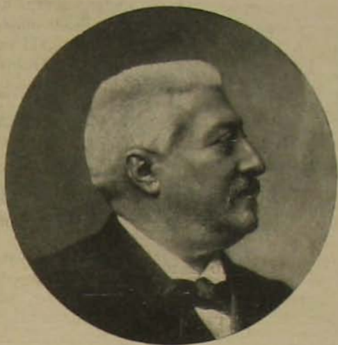
Monis, a megsebesült francia miniszterelnök.