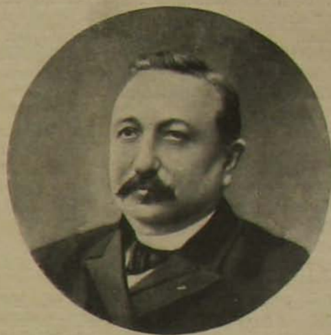
Berteaux, a repülőgép által megölt francia hadügyminiszter.

szinünek látszott, hogy a járőr elfoglaltságát felhasználva, mámoros fejvel nem haza, hanem bement a kocsmá udvarára s ott újból lefeküdvé — elaludt. Itt találta meg őt a tettes, a ki valami okból haragosa lehetett. Az meg éppen valószínűnek látszott, hogy a tettes véletlenül akadhatott rá s miután felismerte s más ütőeszköze nem lehetett, a kezeügyébe eső tűzifa busággal ütötte fejbe a mámorosságánál fogva mélyen alvó legényt. Aztán pedig a busángot és valószínűleg izgatottságában a sörös üveget is otthagya, észrevétlenül elmenekült.