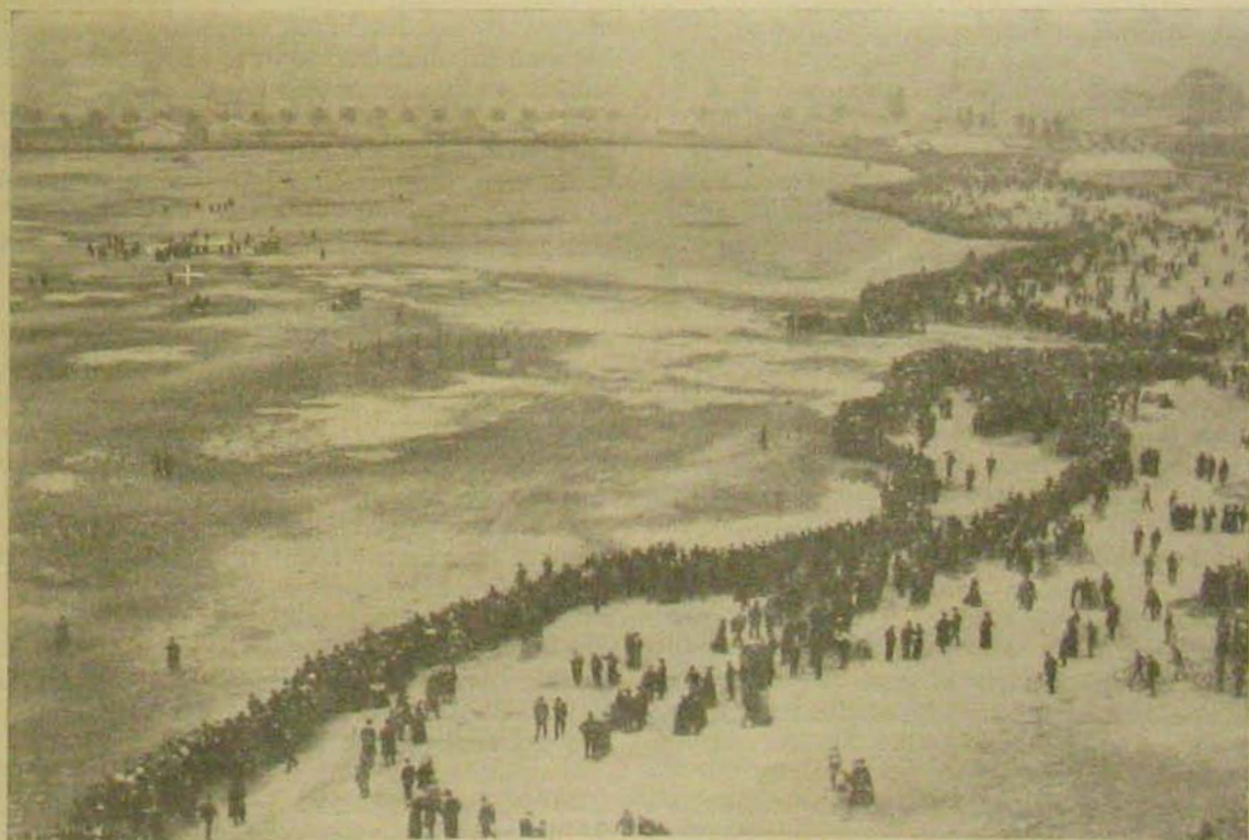
A repülőtér. (A keresztrel jelolt kis csoport a szerencsétlenség színhelyén áll.)