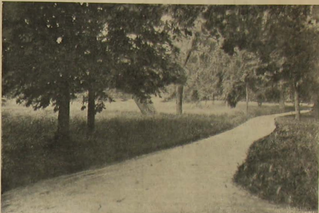
A gödöllői királynapok. — A király sétáltja a parkban.

szépen prédikálnak és oly csúnyán cselekesznek s a fókavadászathoz s mi egyébhez semmit sem értenek.