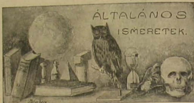
Az északi sarkvidék lakói.

Ezt az eszmét penditse meg hadnagy ur — fejezte be a földbirtokos — és meg fogják látni az urak, hogy ez jobban konvenial az altiszteknek!