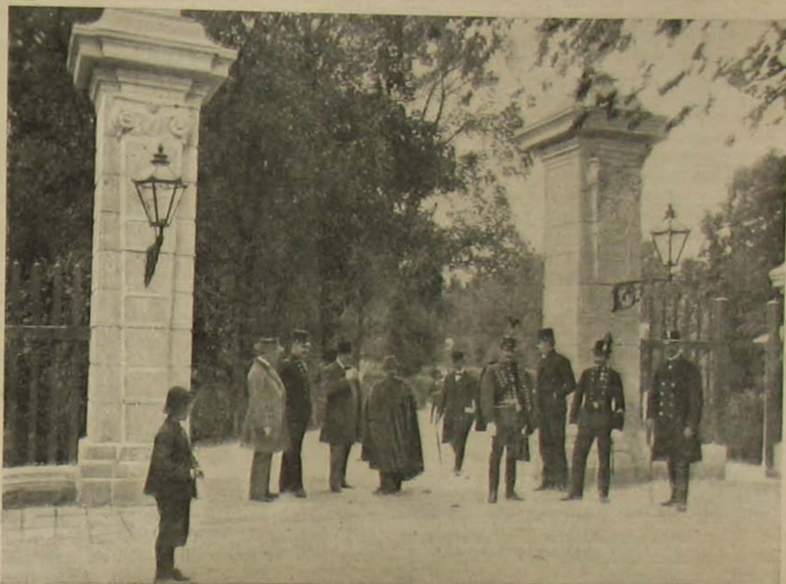
A park kapujában.