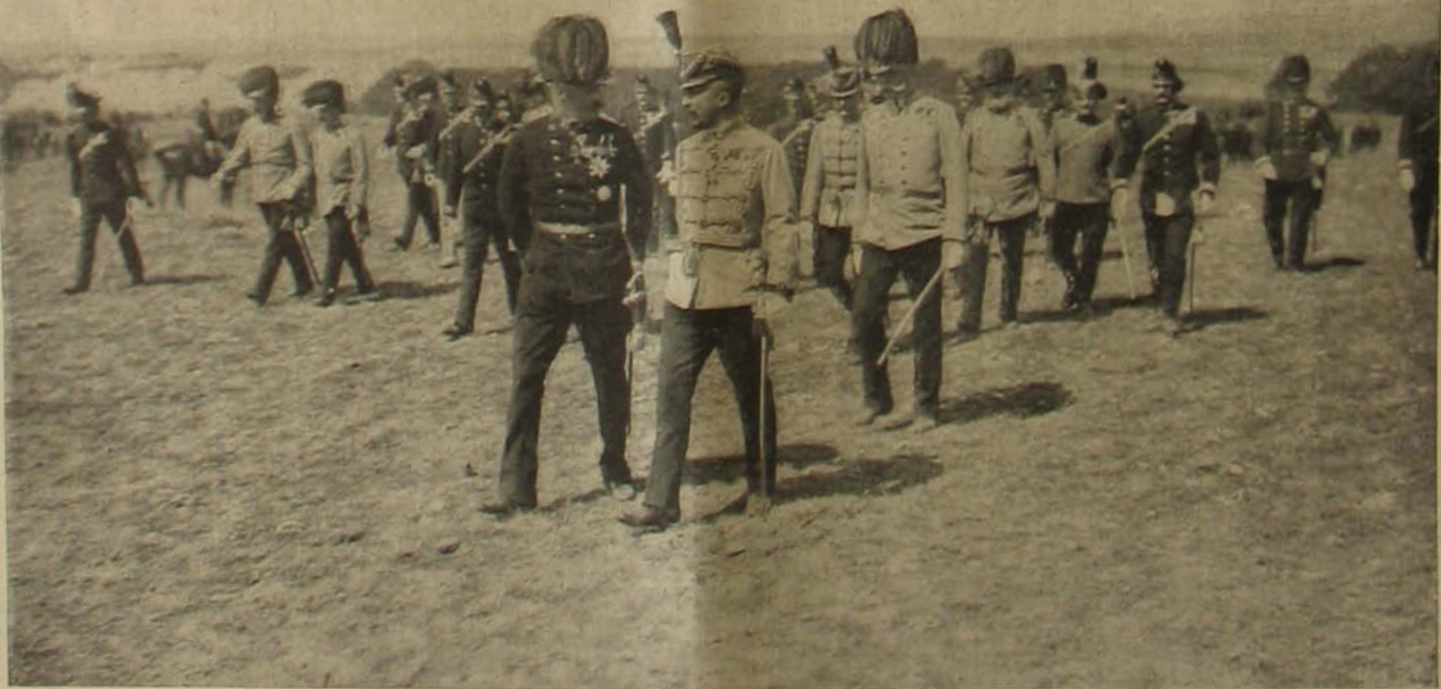
A hajmáskéri katonaváros felszentelése. — Lipót Szalvátor főberczeg, mint a király képviselője, József főberczeggel olvonnal a tűzérkép arzáló előtt.