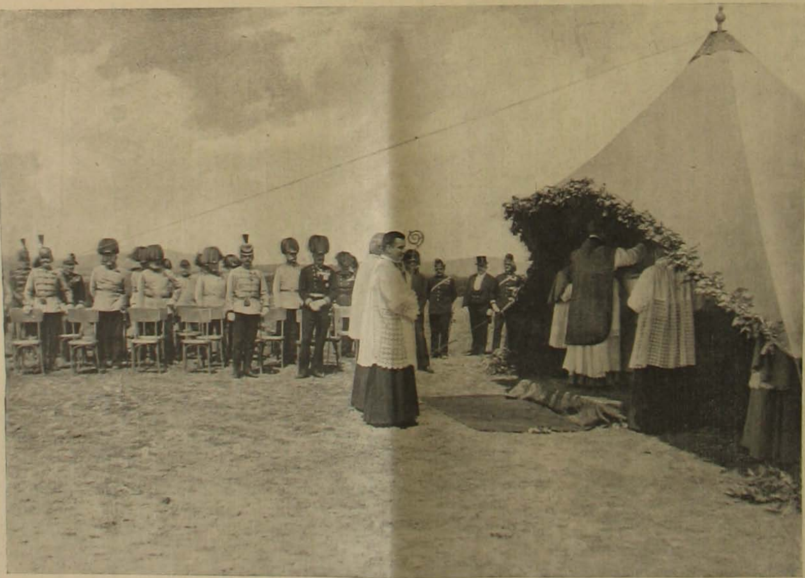
A hajmáskéri katonaváros felszentelése. — Tábori miso a lövőtér.