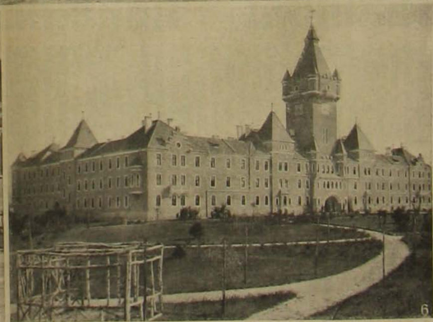
A hajmáskéri katonaváros. — Léghajó-osarnok. — Gyorstüzéld-égyék. — Tüzérségi lövő-iskola. — A főépület.