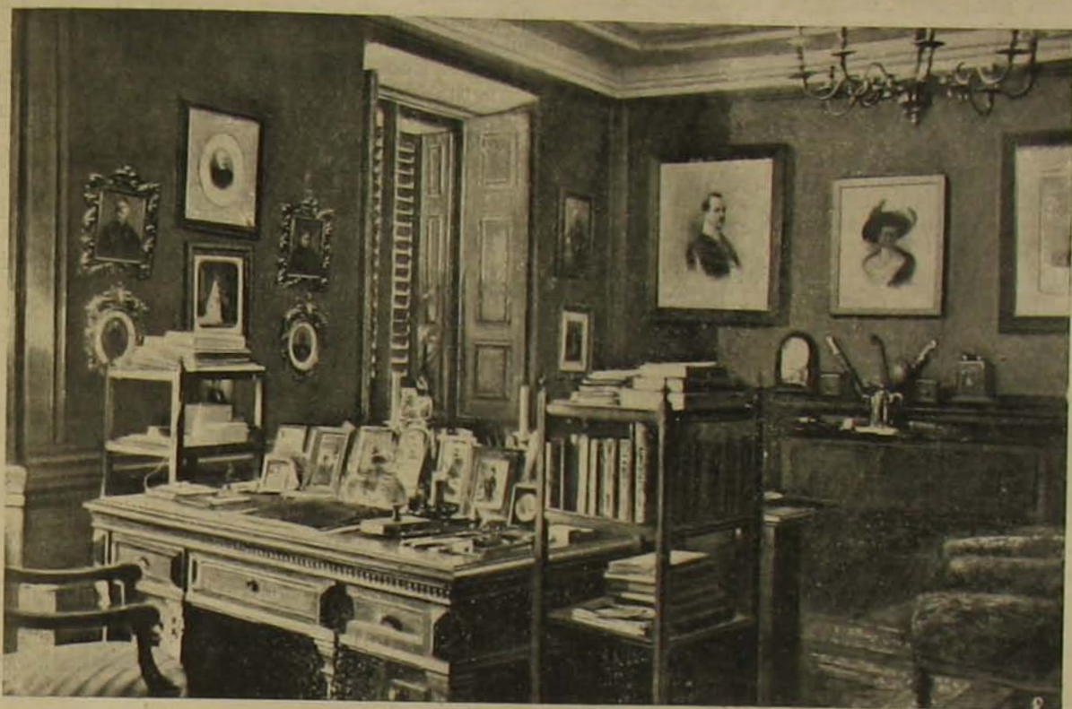
A hédervari kastélyból. — A miniszterelnök dolgozó-szobája.

és a jelzett elődök mikénti működése iránt kíváncsiságot árul el, készségesen elmondják neki, hogy hasonló esetekben ekkor ezt, máskor azt (itt következik bizonyos félre nem érthető kézmozdulat vagy szóbeli kifejezés) vette kezelés alá.