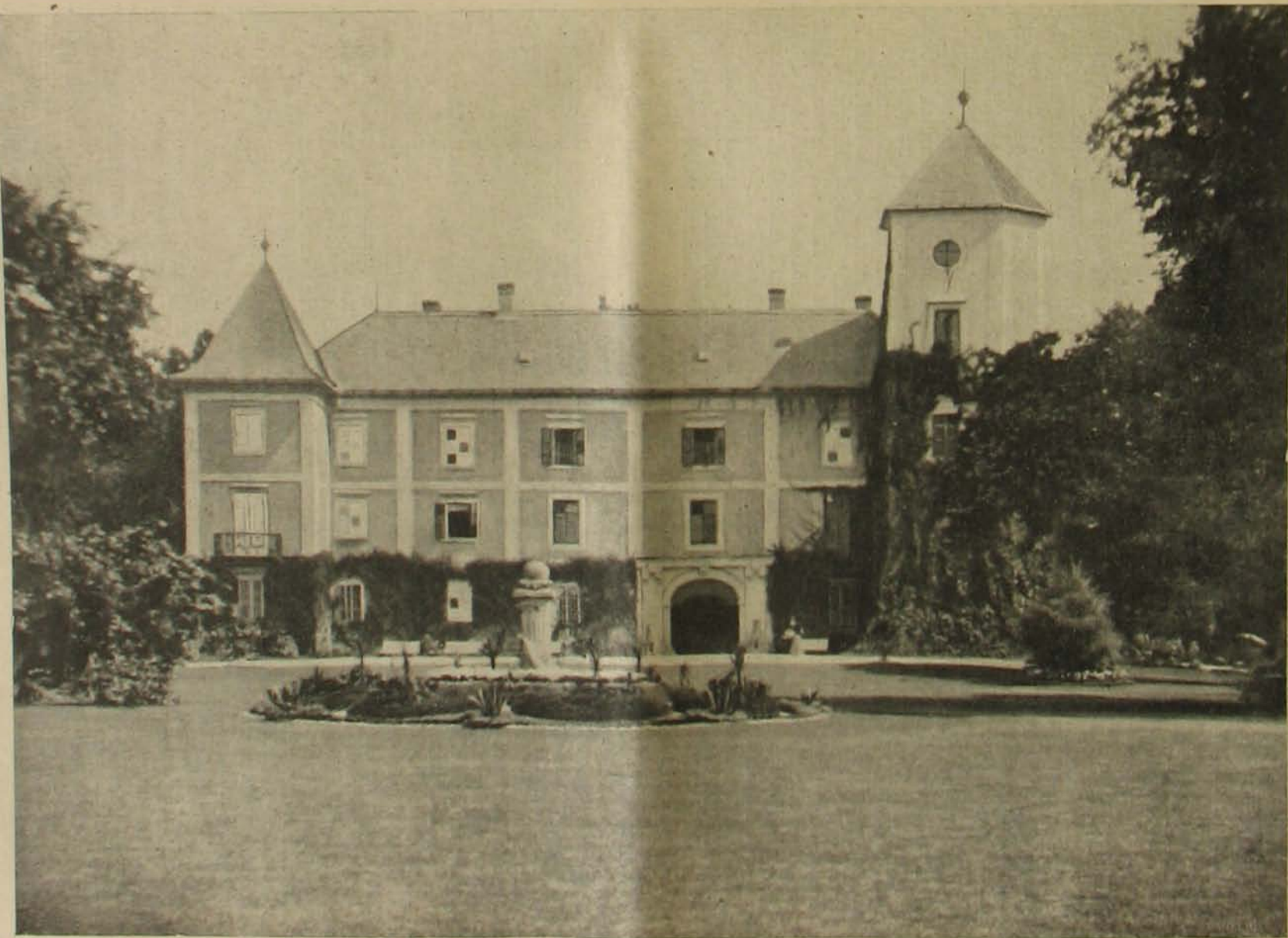
A hédvárali kastély.