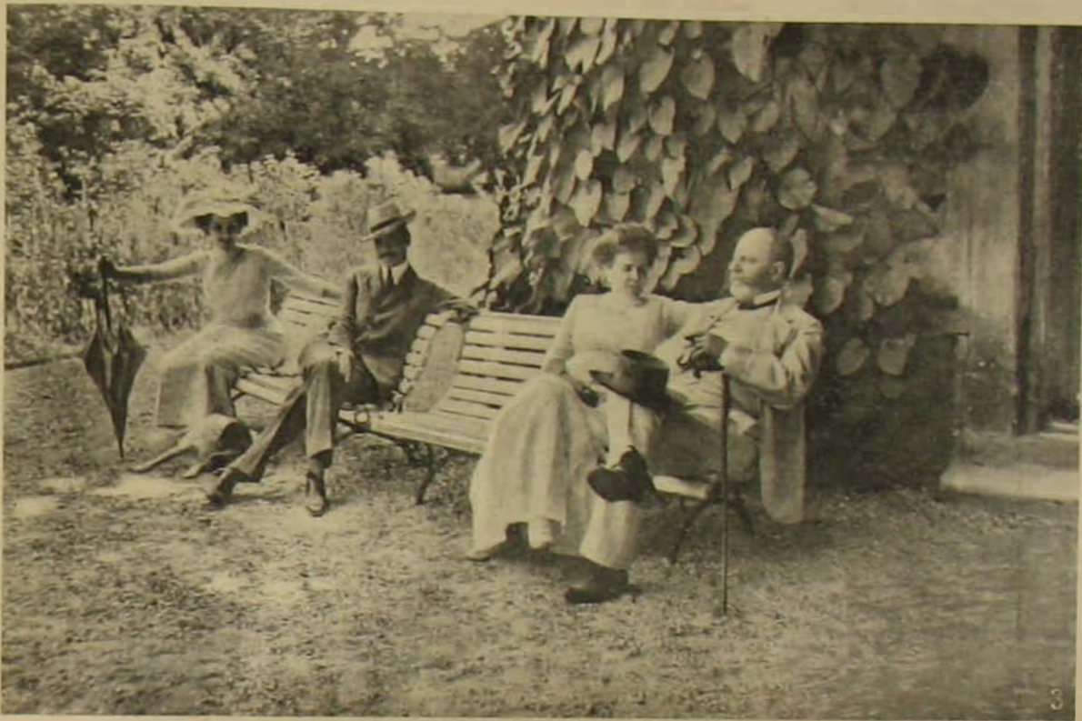
A miniszterelnök családi körben.