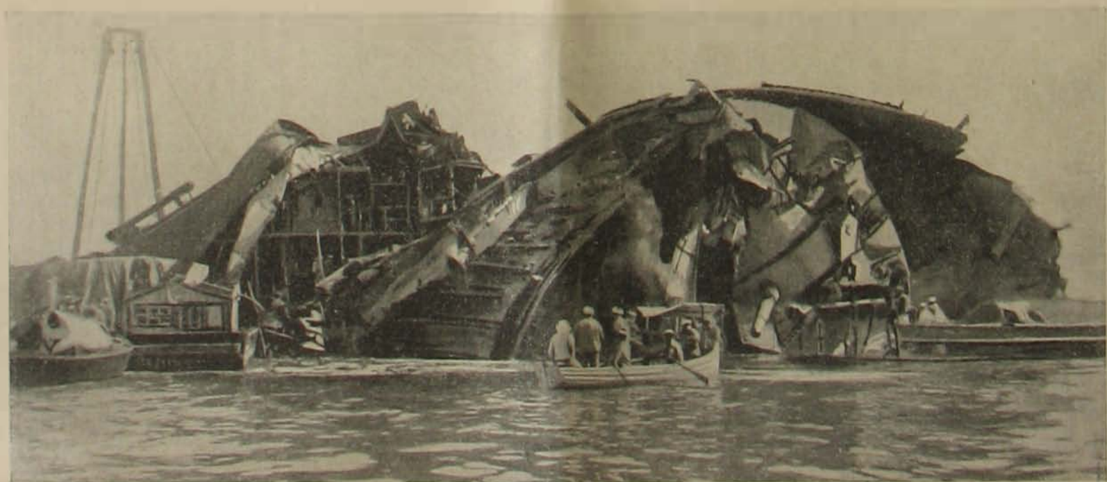
A «Liberty» hadihajó a robbanás előtt és után.