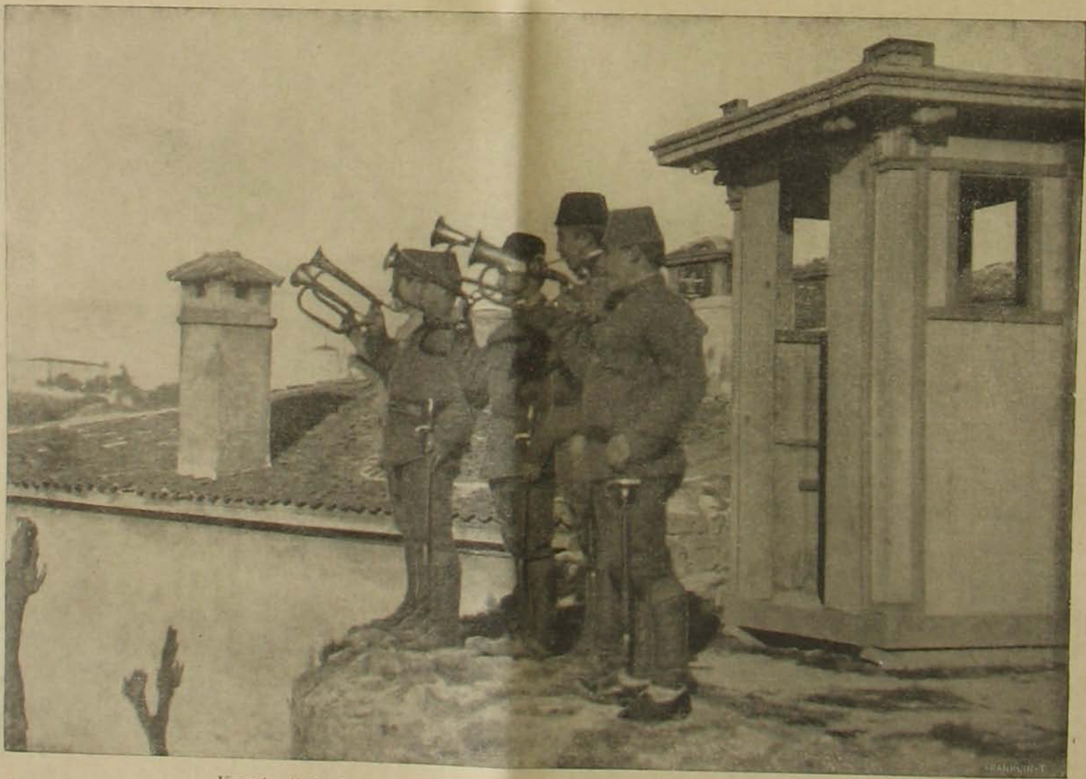
Konstantinápolyban háromszoros trombitajellel kihirdetik a mozgósítást.