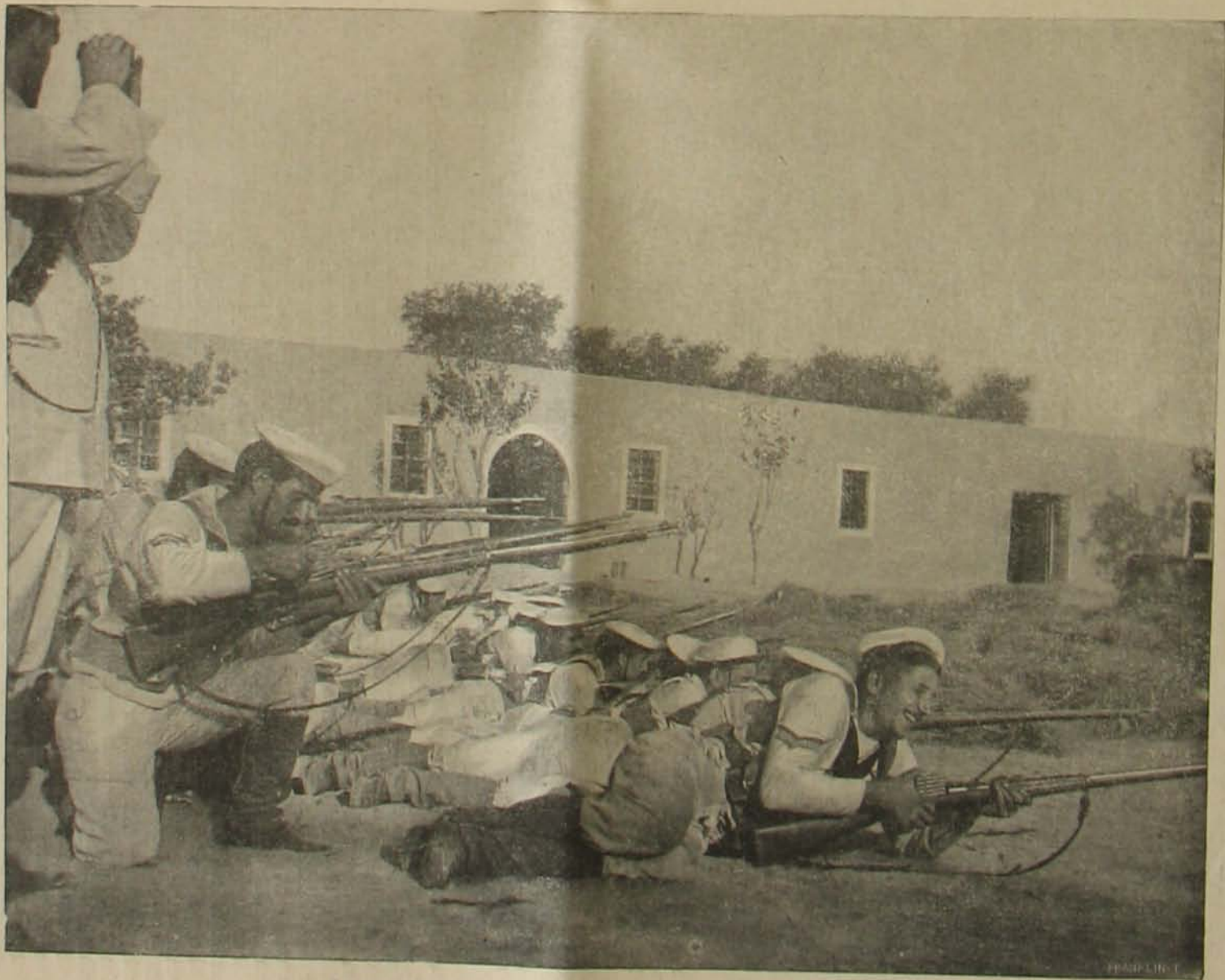
A tripoliszi harczi rról. — Olasz katonák tüzelnek a törökökre.