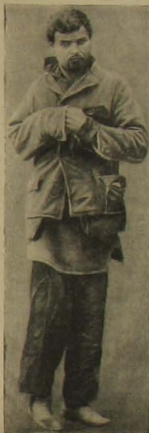
„Az alkohollal áldozata.» Ilyen alakot tucatostul szöndnek össze a pálinka-kereskedésekben razzák alkalmával. A nyomor és ennek népszerű orvosa: az alkohollal züllesztett fogház- és tébolydatöltelékük őket.

Szeszfogyasztás Norvégiában. A szesz fogyasztása félszázad előtt rendkívül nagy pusztításokat tett a skandináv országokban és különösen Norvégiában. Midőn ez az ország a dán uralom alól felszabadult — 1814-ben — a szeszgyártás joga, mely addig állami monopólium volt, áthármlott a polgárságra; ezer meg ezer kis üstben főzték ezt a mérget s mindenki iparkodott elfogyasztani a saját természetét. A merész halászok és hajósok, kik életveszedelmek és az elemek ellen való küzdelmek között szeresték meg a családfőntartásra szükséges keresetüket, mielőtt hazatértek volna, alkohollá változtatták át azt, a miből a családnak meg kellett