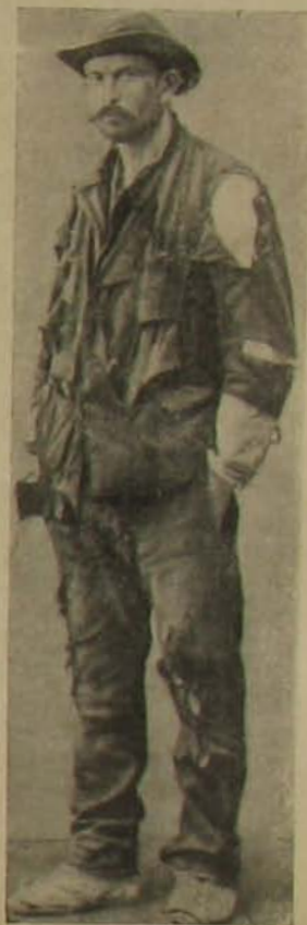
„A javíthatatlan.» Pesti csavargó-típus. Nines dolgozhat Pesten: valóságos dologkerülőre nevelik így az energiátlan elemeket; a tolonczházban kosztot-kváltélyt kapnak, de munkára fogni nem szabad őket.

volna élnie; s a kiket vihar, hullám, zord éghajlat csak edzeni tudott és nem letörni, azokat nyomorékká tette a pálinkás üzletek romlott levegője és mérges itala. Férfiak és asszonyok, kik tanyáikról vasárnaponként templomba parkodtak, ittasan és kábultan jártak az utakon, vagy az útszélen heverték. A skandináv nép egész társadalmát átjárta az a tudat, hogy az egész nemzetet végveszedelem fenyegeti. Törvényes tilalmak nem sokat használtak, míg csak meg nem indult az egész társadalomnak minden tényezője, hogy ennek a nemzetölő pestisnek utjába korlátokat emeljen. S ez a munka egy félszázad alatt bámulatos eredményt ért el. Míg azelőtt évente 32—35 liter szeszfogyasztás esett egy lakosra, addig most egyévi átlag Norvégiában két liter s ebből is jó részt az idegen utazók fogyasztanak el. Igen sokat tettek e tekintetben a mértékletességi egyesületek; ezek eredményezték azt, hogy ma Norvégiában lakosságának tiz százaléka abstinens, mint ott mondják: totalista, azaz semmiféle szeszest italt nem iszik.