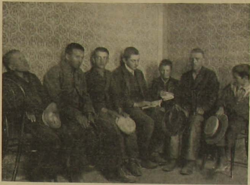
Razzia-képek. — 1. «Fiatl csavargók.» A razzian összeszedett csapat a dunai ka- pitányságon vár a gyermekbírótság döntésére és innen kerülnek a Gyermekvédő Liga vagy valamely patronázs egyesület házaiba.

A kőolajat már az ó-korban is jól ismerték. Herodotos megemlékszik Zacyntbus csodás naphta-forrásairól, Plinius pedig Agrigentumról tesz említést, mint a hol bősé- gesen terem égő folyadék. Sok évvel később Marco Polo írja a bakui naphta-kitörésekről, hogy «e belyen egy hatalmas szökőkút ontja sugarait, a melyeknek égbe- lövellő olajmennységéből egyszerre akár száz hajót is megrakhatnánk. Az étkezéshez ugyan nem használható ez az olaj, de annál alkalmasabb az elégetésre. A beteg