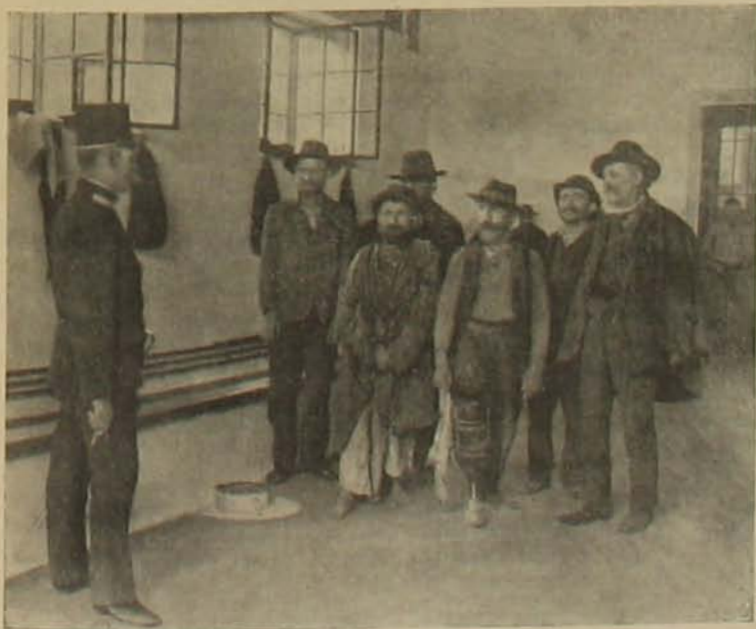
2. «Rapport a tolonczházban.» Munkanélküliek, hajléktalanok. Nagyrészü- nem bűnös, csak szerencsétlen: a nyomor és a páliuka áldozata.

A petroleum eredetéről már sok vita folyt. Régebben azt állították, hogy a kőolaj desztill- láziós termék, amely már a föld keletkezésé- kor származott; de mostanság már megállapo-