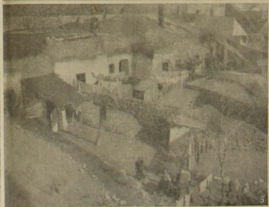
Razzia-képek. — 3. «A két taxli.» Notarin* tolonczházi alakok, a lákot a csavargó-humor keresztelt el taxliknak. — 4. «A zöld kocsi.» Ez a híres zöld kocsi, a mint az új napzporttal érkezik, a Mosonyi utcai tolonczház udvarára. — 5. «Sétán a tyúktotterezben.» A főváros gyűlölet* népe járkal itt: a nyíltkor korzóján. — 6. «Barlanglakósk.» A munkásnép legelőbb tanúján, a Budafoki-uton földbevált odúkban tengődik így ötezer ember, kik közt dúlhang a sokféle betettség.