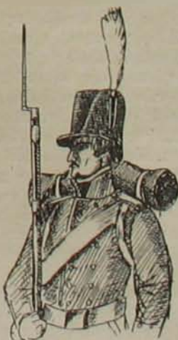
6. ábra. (Legénységi).