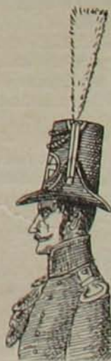
7. ábra. (Tiszti).