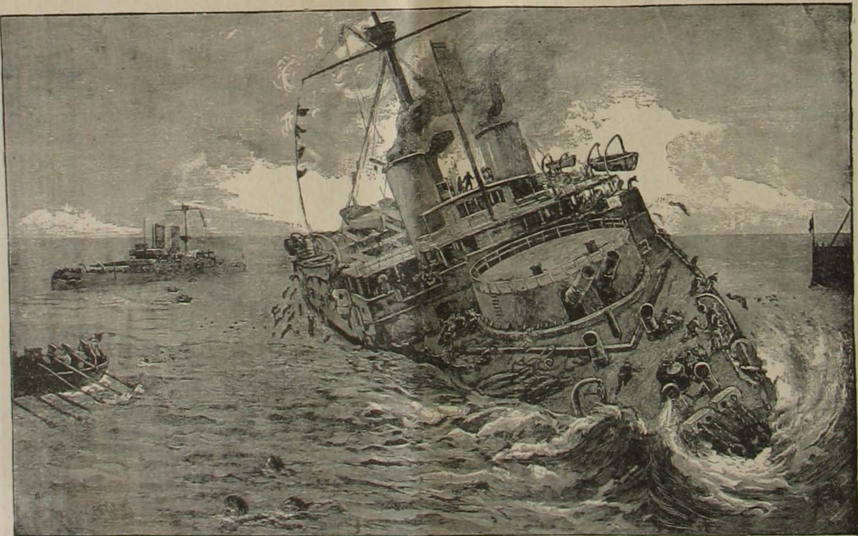
A „Viktoria” angol hajó elsüllyedése (1892 június 22).