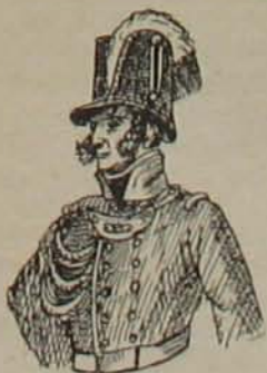
5. ábra. (Tiszti).