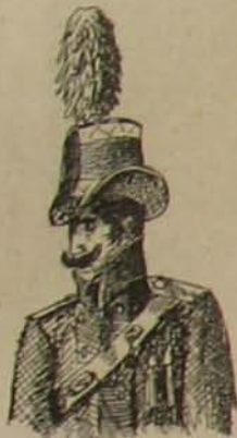
10. ábra. (Tiszt).

Hogy milyen főveget viselnek a külföldi csendőrsegek s mely forma az, a mely általánosan elterjedt — azt majd egy más tanulmány keretében fogom elmondani és bemutatni.