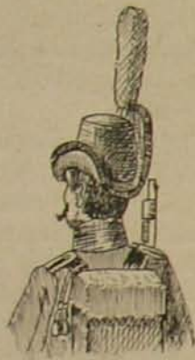
11. ábra. Legénységi.