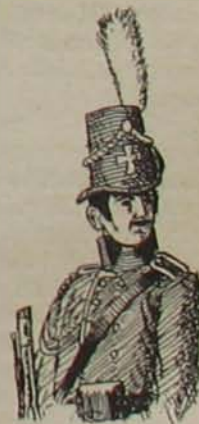
8. ábra. (Legénységi).