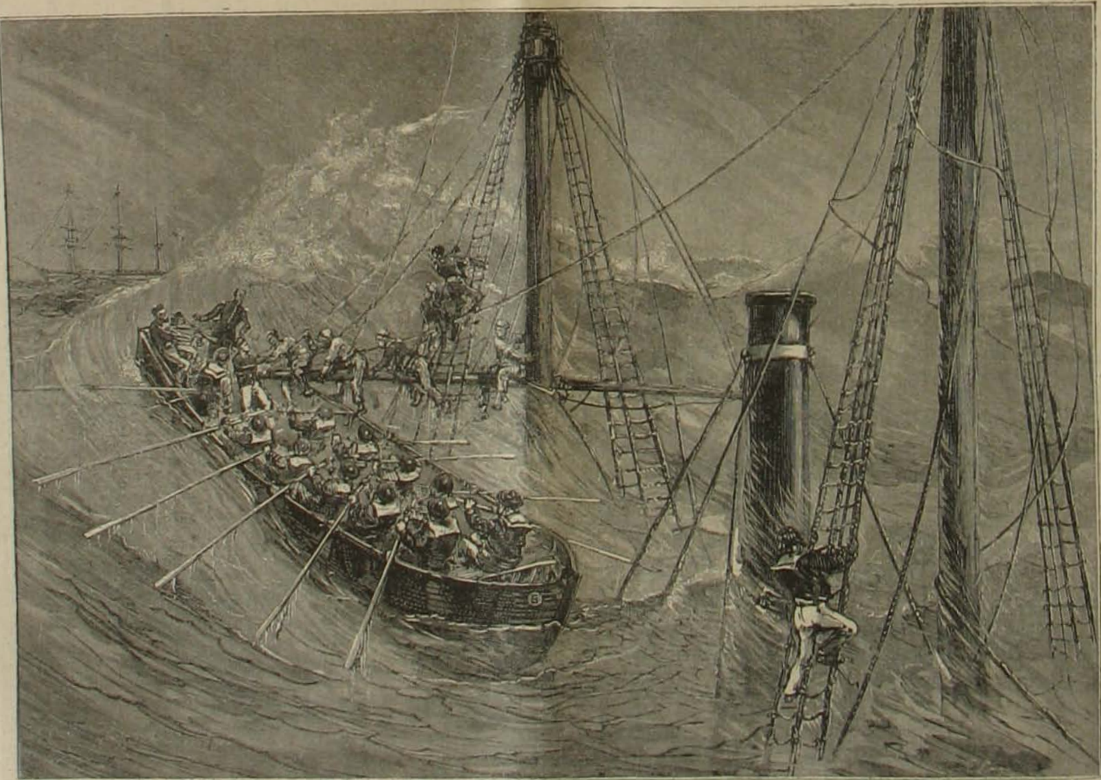
Az árboczra menekültek megmentése az „Arrogante” elsüllyedésekor (1879 márczius 19).