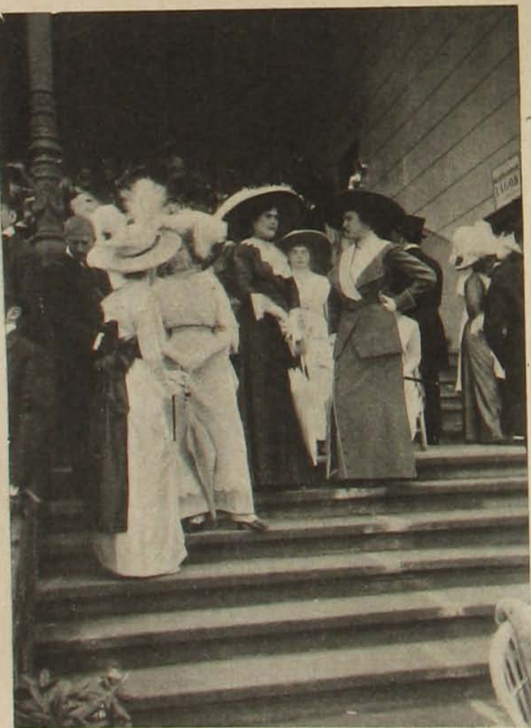
Hölgyek a nagy tribün lépcsőjén.